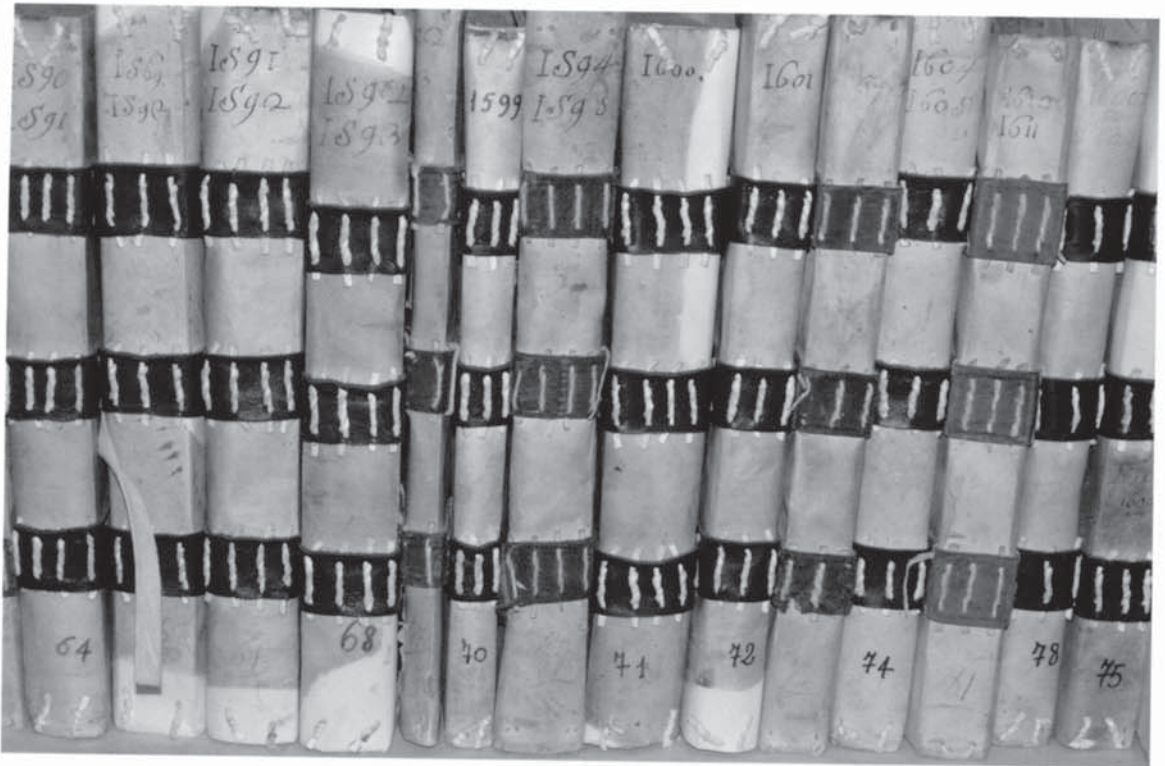
I registri contabili - Entrate e uscite - della Sapienza Nuova. Perugia, Sala 7 di Palazzo Murena, ora sede dell'Archivio storico dell'Università.