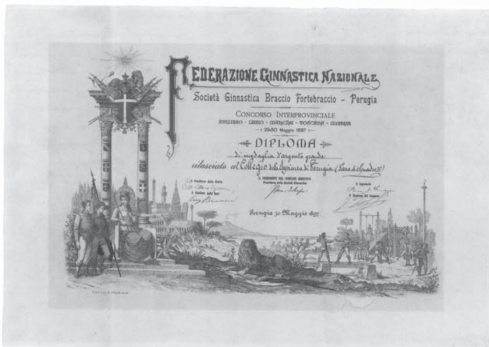
Diploma di medaglia d'argento rilasciato per gara di squadre dalla Federazione ginnastica nazionale, Società ginnastica Braccio Fortebraccio di Perugia, Perugia, 30 maggio 1897. ASUPg, Collegio Pio, Carteggio amministrativo , b. n. 31, fasc. 2, sott. a.1897.