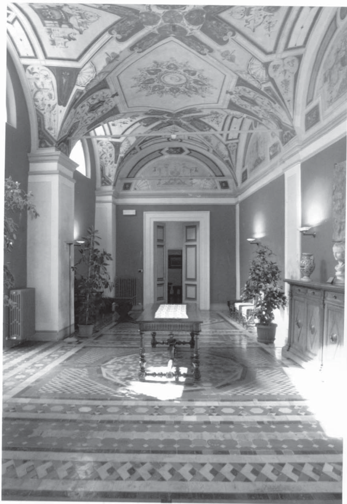
La sala antistante il Teatro della Sapienza, Perugia, Convitto femminile Onaosi.