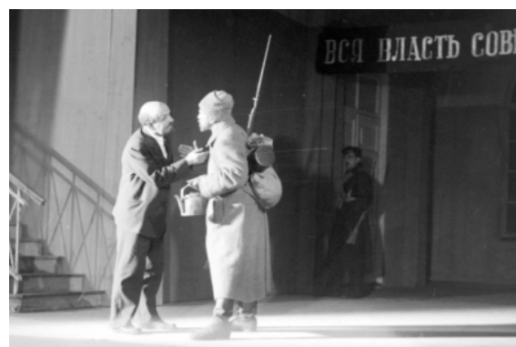
Čelovek Ružem (1937): Ščekin è Lenin