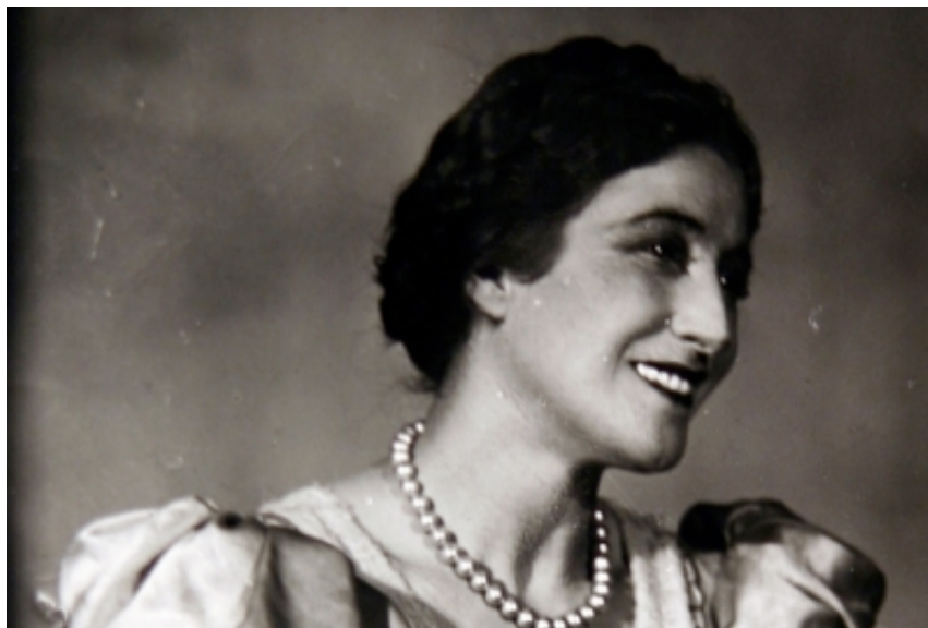
Cecilia Mansurova in Molto rumore per nulla , regia di B. Zachava e I. Rapoport (1936)