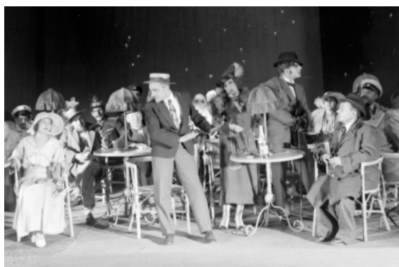
Intervencija (L'intervento, 1933)