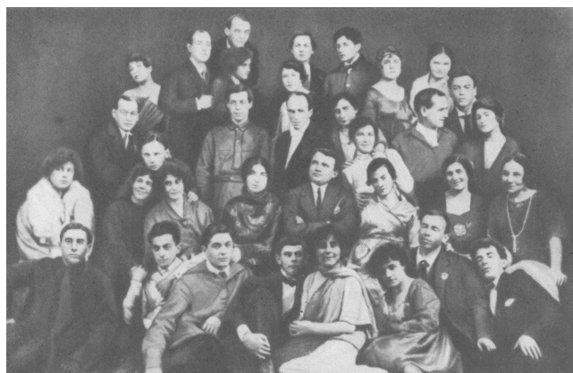
Il Terzo Studio del MCHAT (1921)