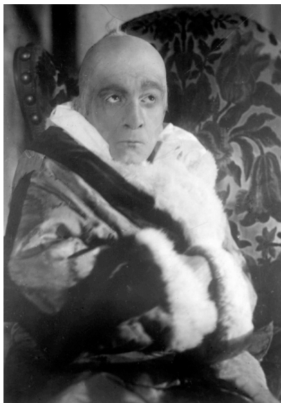
La Carrosse du Saint-Sacrement (da Komedii Merime [Commedie di Mérimée]), regia di Alek (1924)