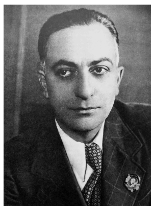
Simonov nel 1939