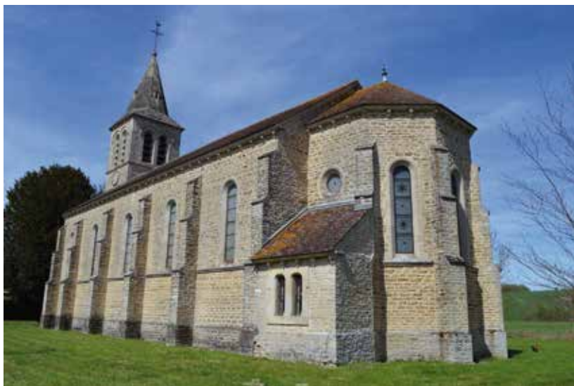
Ill. 1. La collégiale de Lirey dans l'Aube, reconstruite en 1897.

Il est peu connu que l'une des plus célèbres reliques du christianisme, le Saint Suaire de Turin, dans ses pérégrinations au Moyen Âge est passé en Belgique. Pour bien comprendre les sources d'information, il faut avant tout quelque peu résumer l'histoire des origines du précieux tissu.