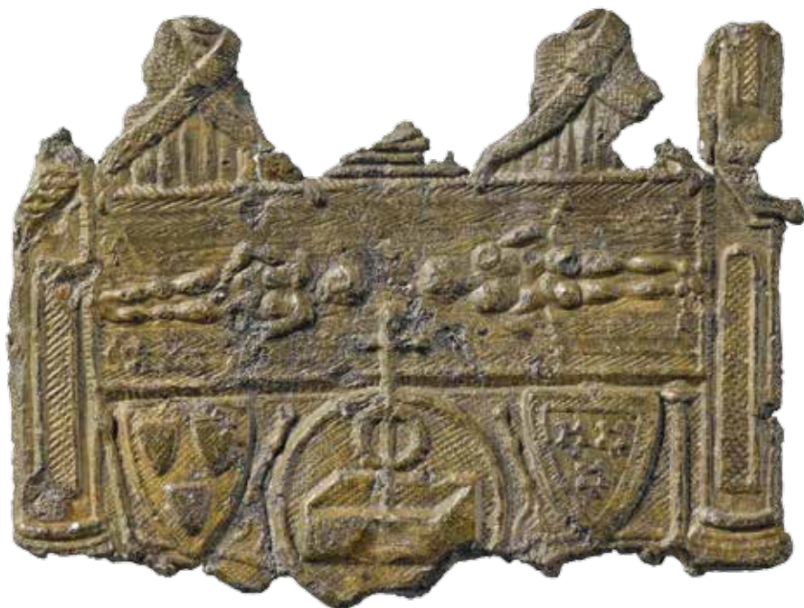
Ill. 3. Enseigne de pèlerinage en plomb représentant le Suaire et provenant de Lirey (vers 1355-1410). Paris, Musée National du Moyen Âge, CL 4752.

La présentation du Suaire à Chimay est décrite par le chroniqueur Corneille de Zantfliet. Né vers la fin du XIV e siècle dans la ville