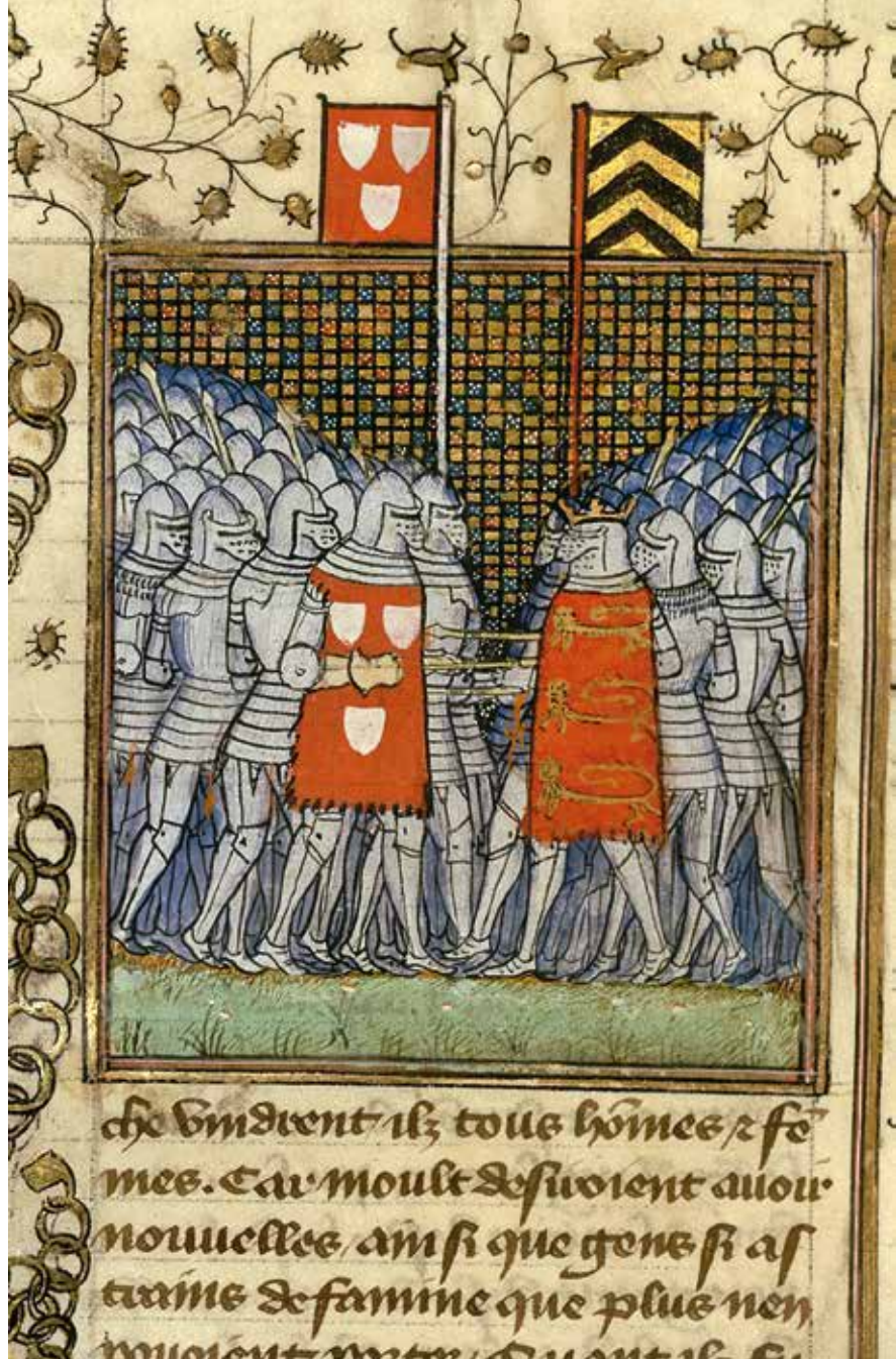
Ill. 2. Maître de Giac, Geoffroy I de Charny et Édouard III d'Angleterre à la Bataille de Poitiers , miniature, premier quart du XV e siècle. Paris, Bibliothèque nationale de France, ms Français 2662, folio 172v.

et représentation du Saint Suaire dans lequel a été enveloppé le précieux corps de notre Seigneur Jésus-Christ », de telle sorte que « chaque jour les habitants de Champagne et des régions voisines affluaient à l'église pour adorer ce tissu, sans crainte de commettre d'idolâtries » (ill. 3). Le Suaire était montré « avec les torches allumées et des prêtres revêtus de parements, comme s'il s'agissait du vrai Suaire du Christ », ce qui est « une tromperie et une irrévérence envers la Sainte Mère l'Église et la foi orthodoxe 2 ». C'est dans un long mémoire que l'évêque mit par