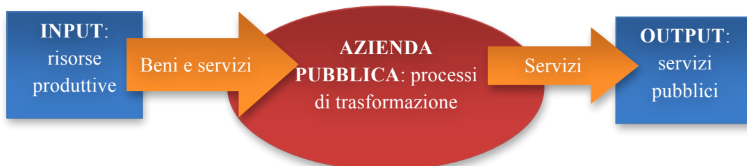
Figura n.1 – Processo di Trasformazione di Input in Output