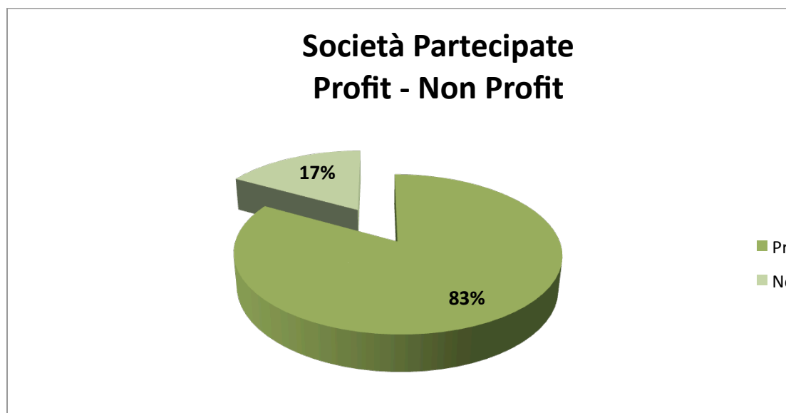
Figura n. 3 - Società Partecipate Profit – Non Profit

Le 919 società partecipate dei Comuni Capoluogo di Provincia possono essere a loro volta suddivise tra società profit e non profit. Si evidenzia anche attraverso la figura n. 3 la composizione del campione relativo alle 919 società partecipate nella rispettiva suddivisione tra Profit e Non Profit.