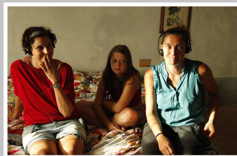
fig. 4 Immagine dal set de Le meraviglie di A. Rohrwacher, 2014