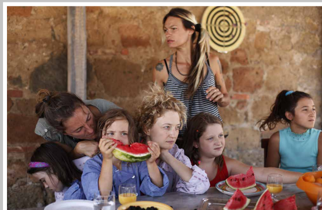
fig. 6 Immagine dal set de Le meraviglie di A. Rohrwacher, 2014