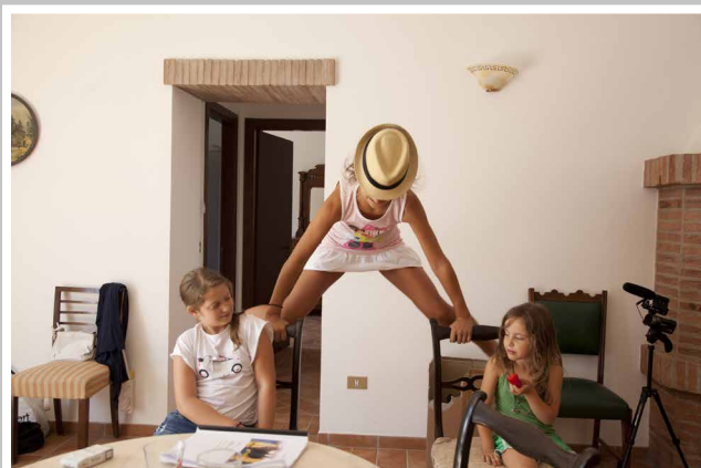
fig. 5 Immagine dal set de Le meraviglie di A. Rohrwacher, 2014

M. PIERINI, 'I non attori che sanno recitare. Pratiche di casting e coaching nel cinema italiano contemporaneo', Bianco e nero , 581, gennaio-aprile 2015, pp. 12-18.