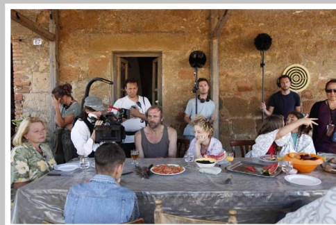
fig. 2 Immagine dal set de Le meraviglie di A. Rohrwacher, 2014