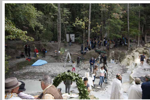
fig. 1 Immagine dal set de Le meraviglie di A. Rohrwacher, 2014

Il set è prossimità, anche fisica. Girare un film vuol dire essere a stretto contatto gli uni con gli altri, le une con le altre. E i set, come è noto, possono essere luoghi percorsi da tensioni molto forti, anche violente, da conflitti e asperità. Il set di Rohrwacher, stando alle testimonianze – e come rivelano le fotografie – è abbracciato dallo sguardo della regista [fig. 3] e abitato da persone che stanno vicine in virtù di legami costruiti nel tempo, attraverso dialoghi, conversazioni, scambi, viaggi alla ricerca di location o di semplici suggestioni, confronti sulla sceneggiatura, su un dettaglio di scenografia, di un costume o di un'acconciatura. Questo fa sì che le donne che vi lavorano non solo si sentano intimamente parte di qualcosa, non discriminate bensì valorizzate rispetto ad altri contesti lavorativi analoghi, ma siano anche unite da quella che potrei definire una sorellanza d'elezione – senza dimenticare ovviamente la sorellanza di sangue, quella tra Alice e Alba Rohrwacher – che nasce da un ri-