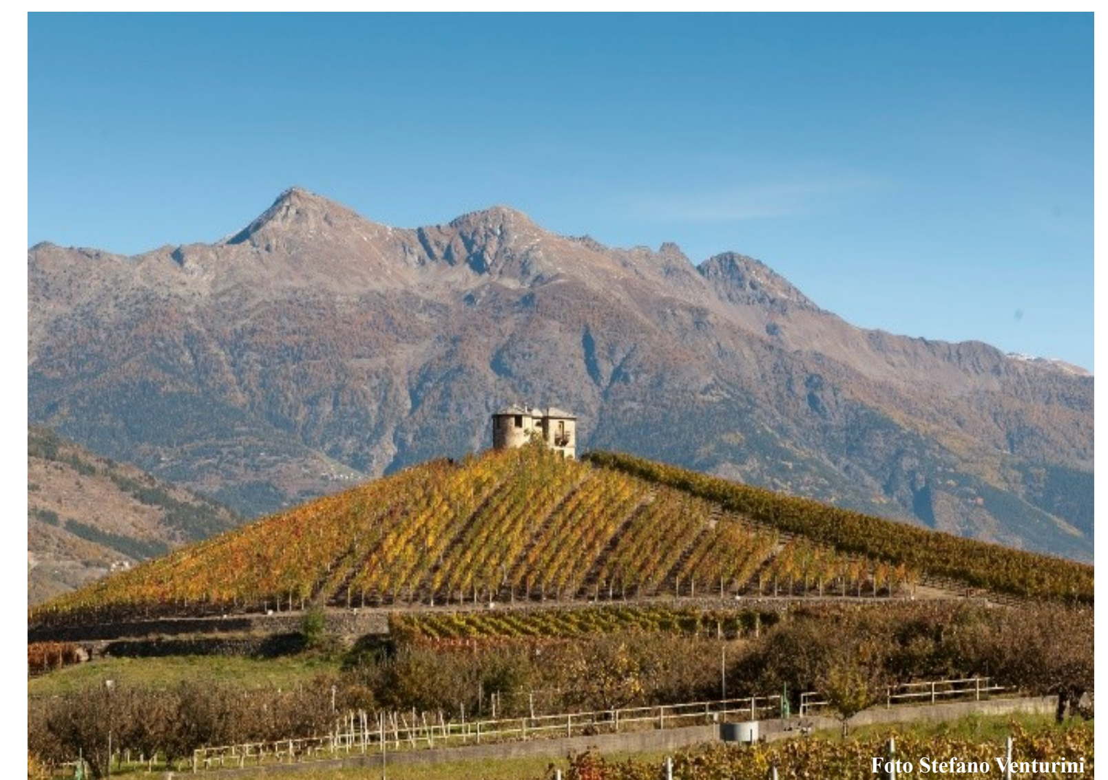
Vineyards in Aymavilles (AO)