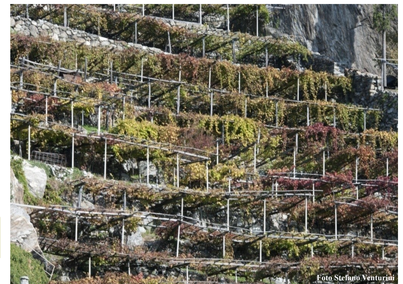
Vineyards in Donnas (AO)