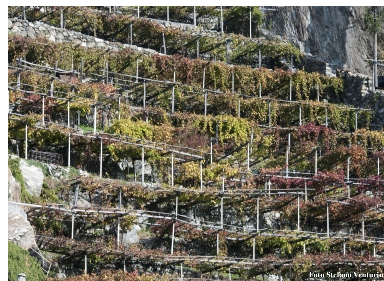
Vigneti a Donnas (AO)