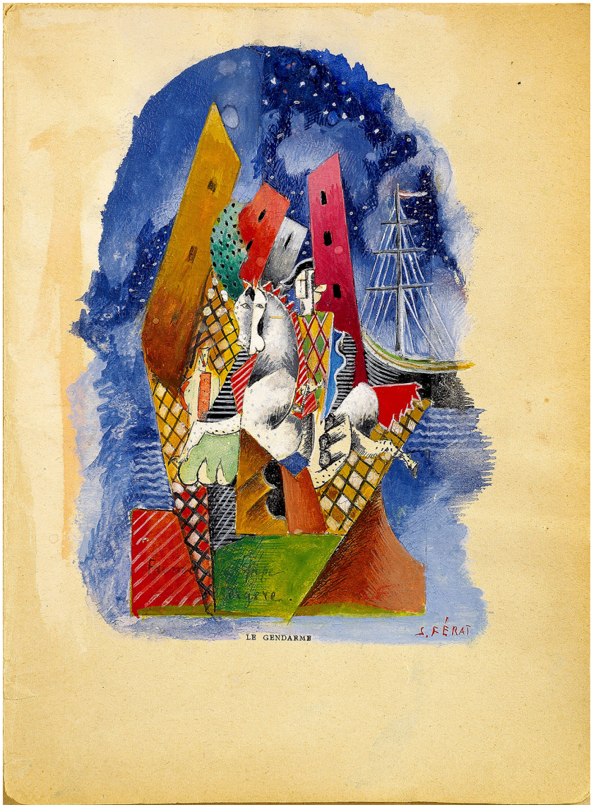
Serge Férat, Le gendarme. Arlequin trismégiste, 1917-18, gouache, in Guillaume Apollinaire, Les Mamelles de Tirésias, Éditions SIC, Paris 1918, p. 38. Fondo Férat, collezione privata, Francia