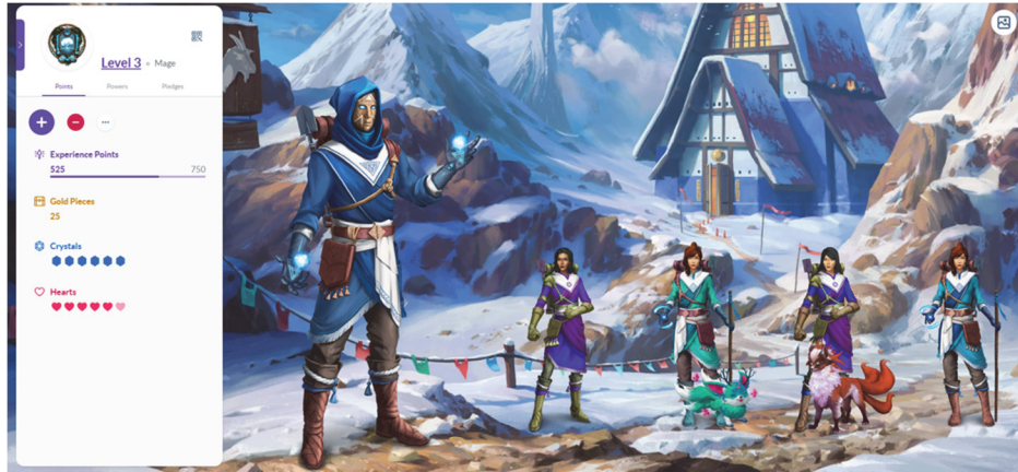
Fig. 2 - Esempio di personaggio avatar

Ogni partecipante può guadagnare o perdere punti esperienza in relazione ai criteri stabiliti e individuati insieme al docente. Quest'ultimo ha la possibilità di inserire tutti i comportamenti positivi (i criteri che aumentano il punteggio di ogni giocatore) e di inserire i punti corrispondenti a ogni azione. La Fig. 3 ne è un chiaro esempio, in cui i comportamenti come “partecipazione attiva”, “incarico appunti lezione” ecc..., sono stati concordati insieme al docente e inseriti nell'ambiente.