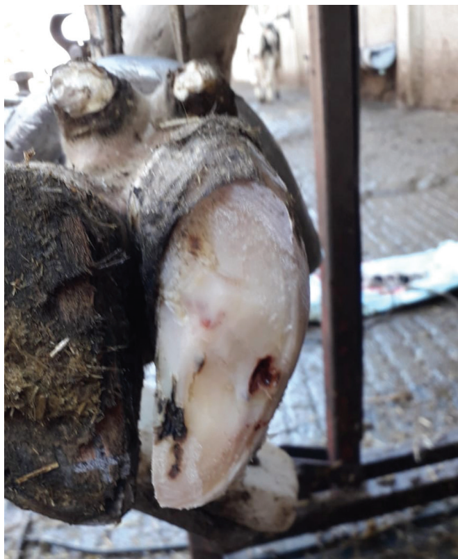
Foto 1. Malattia della linea bianca.

Attualmente la maggior parte delle aziende alimen-