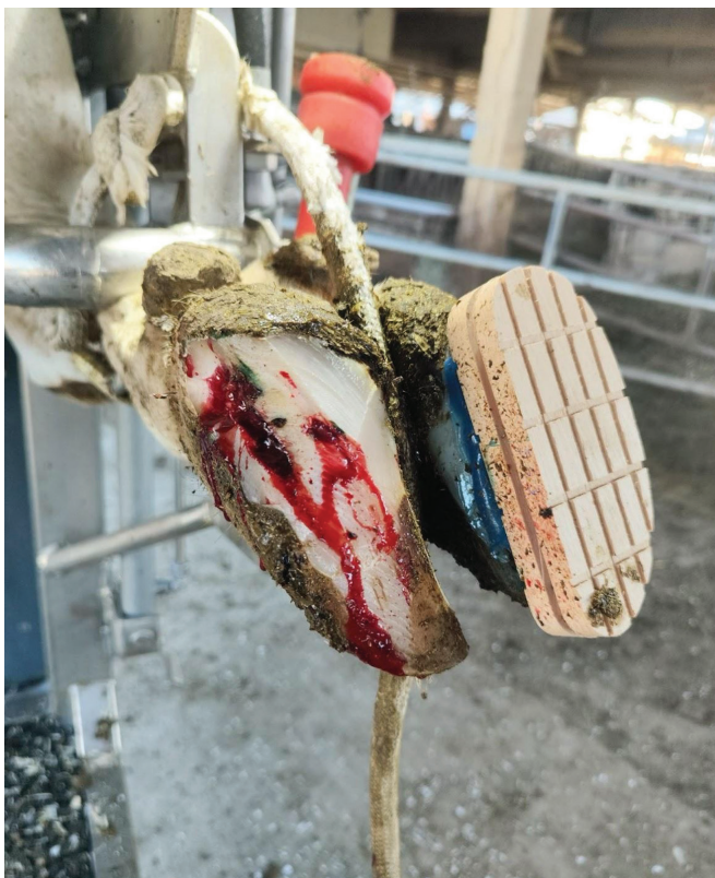
Foto 5. Evoluzione della malattia della linea bianca.