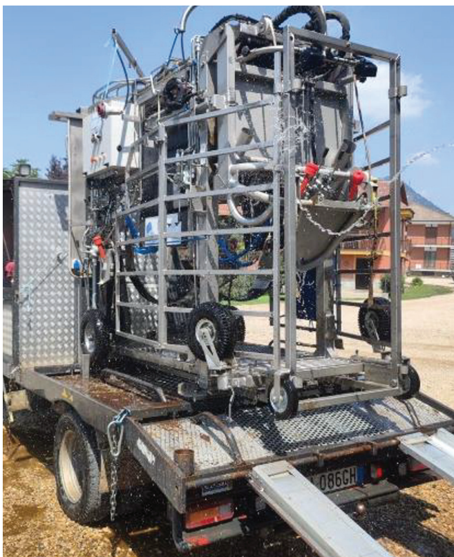
Foto 7. Gabbia di contenimento.