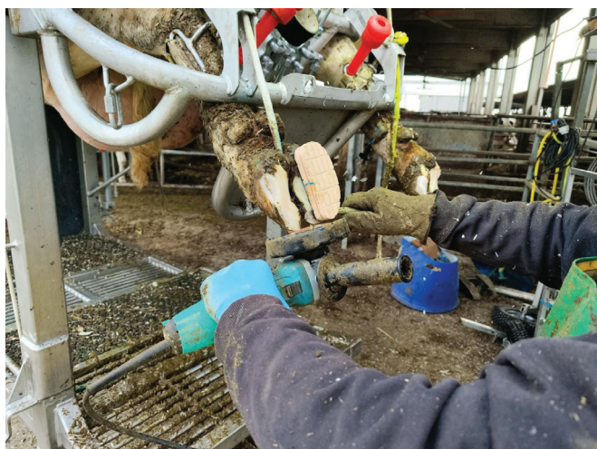
Foto 9. Utilizzo del flessibile.

Questi sistemi di rilevamento, per quanto non sempre attuabili in azienda, consentono di non trascurare lesioni che, diventando croniche, possono richiedere terapie molto lunghe e costose, causando nei casi più gravi l'eliminazione dell'animale dal sistema produttivo.