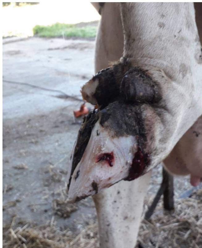
Foto 2. Particolare della patologia.