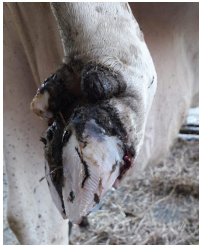
Foto 6. Pareggio terapeutico.