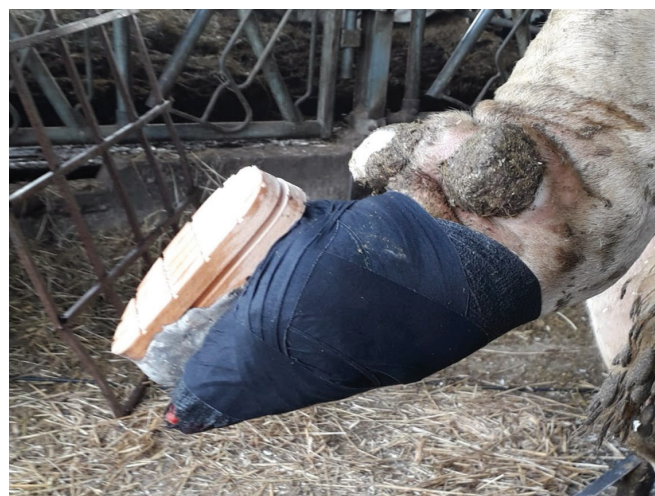
Foto 10. Fasciatura protettiva.