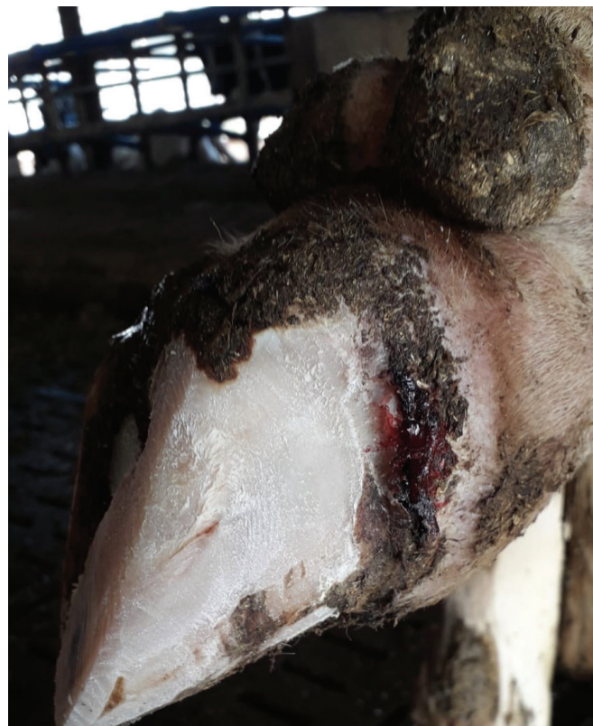
Foto 4. Evoluzione della malattia.