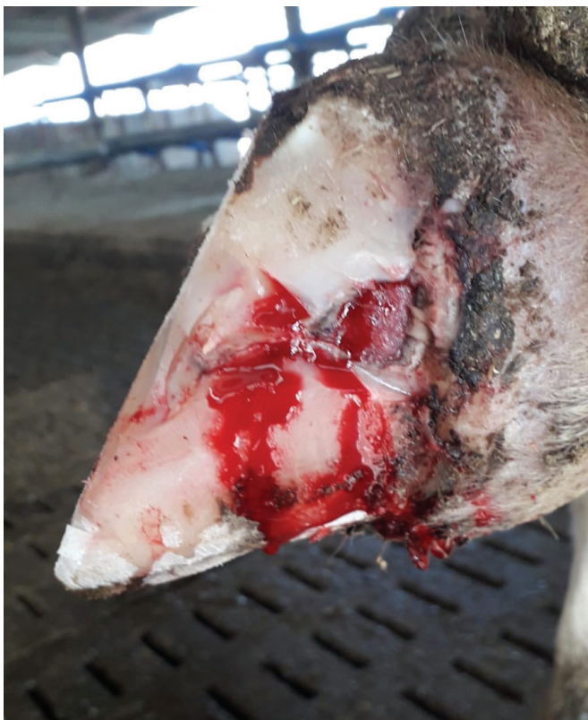
Foto 3. Forma atipica della malattia della linea bianca.