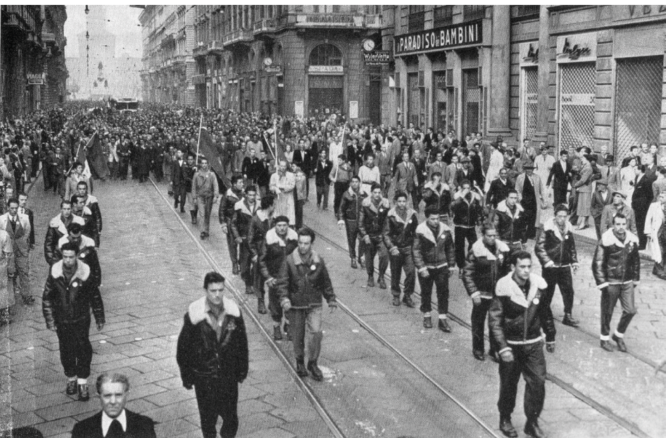
Milano, 25 aprile 1948: gli uomini della "Volante Rossa" aprono il corteo del PCI.