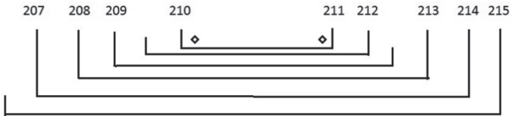
FIG. 2 – Paris, BnF, fr. 2827 : structure du cahier 27.

Dans F48 la situation est légèrement différente : la Continuation commence au f. 215vb et elle suit sans coupure le dernier paragraphe de Guillaume de Tyr. Le f. 215 était pourtant originairement un feuillet isolé, collé à la fin d'un cahier (numéro 27) qui est le seul dans le manuscrit à avoir subi des réaménagements :