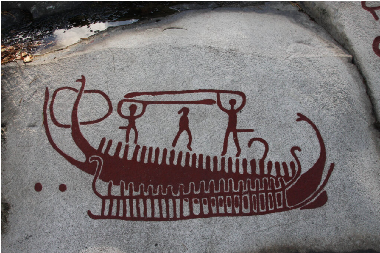
Strömstad Massleberg Skee 614

L'uso di scanner ad alta risoluzione (es. HandySCAN 700) produce mesh 3D che possono essere elaborate con l'intelligenza artificiale per rimuovere rumori, curvatura della roccia e interpolare dati mancanti. Questo può migliorare la leggibilità delle incisioni e consente studi comparativi più precisi.