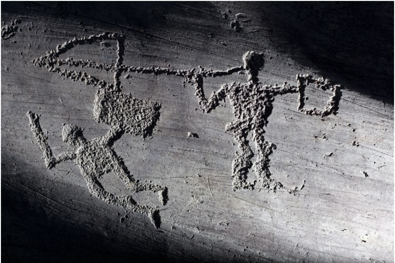
Foppe di Nadro, scena di duello

Per quanto riguarda le tecnologie utilizzate, il progetto si è basato sull'uso di scanner 3D e fotogrammetria per ricostruire le superfici rupestri in alta definizione, ha fatto ricorso all'intelligenza artificiale sotto forma di reti neurali convoluzionali (CNN) per sperimentare il riconoscimento automatico di forme (uomini, animali, armi, etc.), di reality computing e realtà aumentata (AR) per esplorazioni immersive finalizzate alla divulgazione/educazione, oltre che di ontologie semantiche per classificare e strutturare le informazioni.