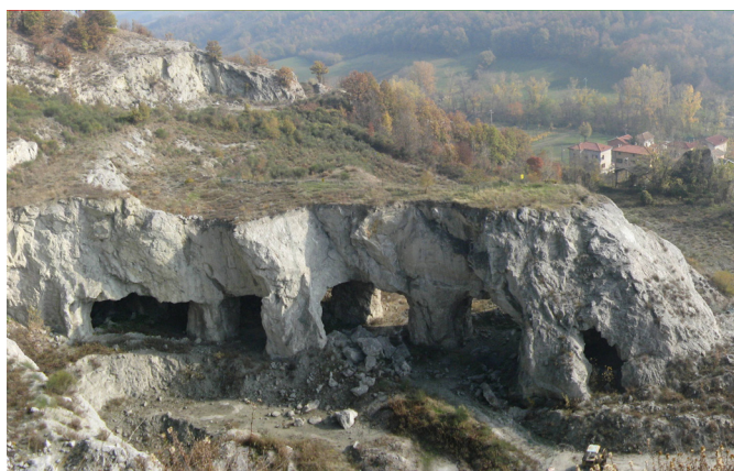
Fig. 1 – Foto panoramica del “Dinosaurio”.

Le osservazioni nella parte esterna della cava hanno evidenziato alcune situazioni problematiche. In particolare, i crolli delle volte delle gallerie superiori portano alla formazione di grandi voragini (in particolare nei livelli +4 e +5) e di una pericolosa subsidenza (associata al livello +6) che potrebbe evolvere in un crollo improvviso. Con ogni probabilità queste criticità sono le più importanti di tutta l'area estrattiva. Anche l'apparato roccioso detto “Dinosaurio” (in corrispondenza al livello 0) risulta essere piuttosto instabile e presenta una elevata probabilità di crollo (fig. 1).