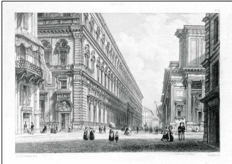
Il palazzo dell'Accademia delle Scienze

Nel 1832 viene nominato Socio dell'Accademia delle Scienze di Torino.