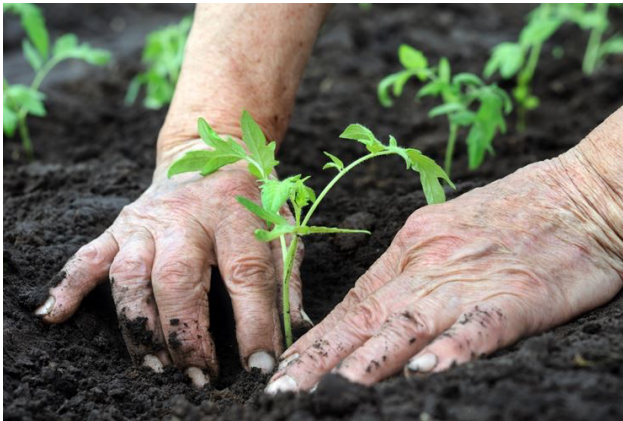
Figura 4 Carote (sinistra)

«Certo»! Se non osservi la luna, non cresce quello che semini. Il nonno mi ha spiegato che le verdure che si sviluppano sottoterra (come le patate e le carote) debbono essere seminate quanto la luna è calante.