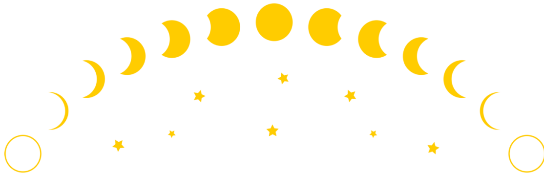
Figura 2 Fasi lunari

C'è un vecchio detto che mi ricorda sempre il nonno: «Gobba a ponente luna crescente, gobba a levante luna calante».