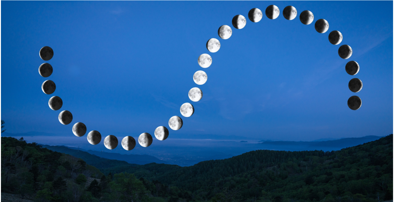
Figura 1 La danza della luna

«La danza della luna»? «Sì, Chiara, guarda questa fotografia».