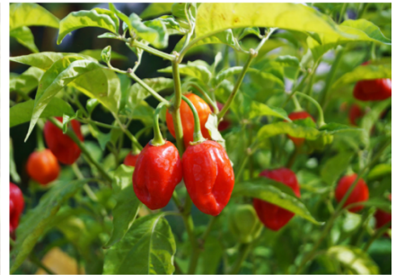
Figura 5 Pomodori, zucchine e peperoni

Se un giorno vuoi venire a vedere l'orto del mio nonno, beh, è un giardino!