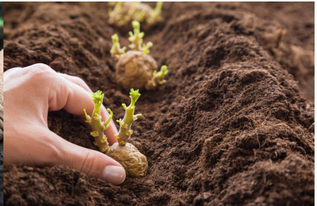
Figura 5 patate (destra)

Mentre le verdure che crescono in altezza (come le zucchine, i peperoni, i pomodori) debbono essere seminate quando la luna è crescente.