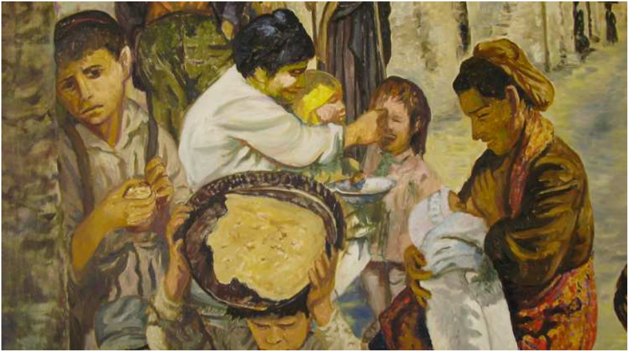
Carlo Levi, Lucania , particolare, Museo Nazionale di Matera.