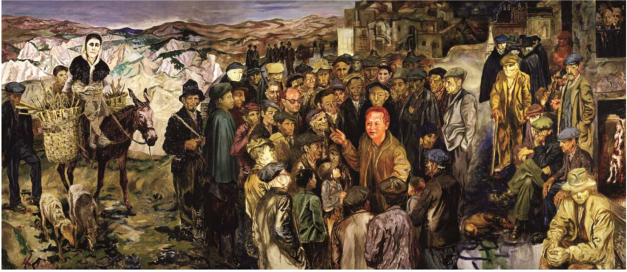
Carlo Levi, Lucania , particolare, Museo Nazionale di Matera.