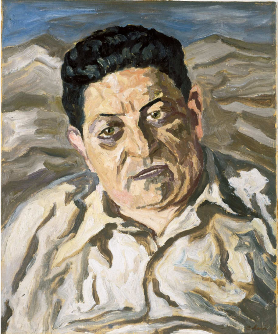
Carlo Levi, Ritratto di Giuseppe Di Vittorio , segretario generale della CGIL, 1952.