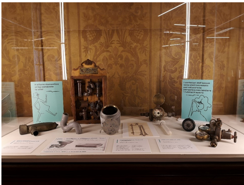
Fig. 4 Particolare di una teca allestita in Sala Gigli. Esempari di sifoni e contatori per l'acqua.

Dal cantiere alla città: Luigi Pagliani e sodali intuiscono, tra i primi, gli enormi vantaggi dati dalle scoperte batteriologiche per la salute della popolazione. Una strumentazione tecnica sempre più precisa, spesso perfezionata dagli stessi studiosi che portano avanti parallelamente ricerca e strumenti di misura, apre le porte a indagini via via più approfondite sulle cause e sulle cure dei mali della seconda rivoluzione industriale 18 . Viene quindi attivata a Torino una sistematica opera di interventi strategici e puntuali per contrastare epidemie e per ridurre il tasso di mortalità. Acquedotti con acqua fresca montana, con sistemi ad acqua corrente che sostituiscono le antigeniche vasche-serbatoio solitamente poste nei sottotetti delle abitazioni, osmotizzatori per i centri di cura, fognature a sistema separato per ottimizzare lo sfruttamento delle acque di scarico, sono le azioni principali di una equipe interdisciplinare composta da ingegneri, architetti, medici, biologi, igienisti che si approccia sempre con metodo accademico e con continui confronti e opposizioni per avvalorare tesi e progetti. Servizi pubblici quali ospedali, bagni, scuole, macelli, crematori cimiteriali, sono parte organica di un efficace nuovo Ufficio d'Igiene cittadino che si occupa in dettaglio di neonati, operai, pulizia e igiene cittadina, e, in particolare, della salubrità e della composizione dei luoghi per la nuova casa per tutti.