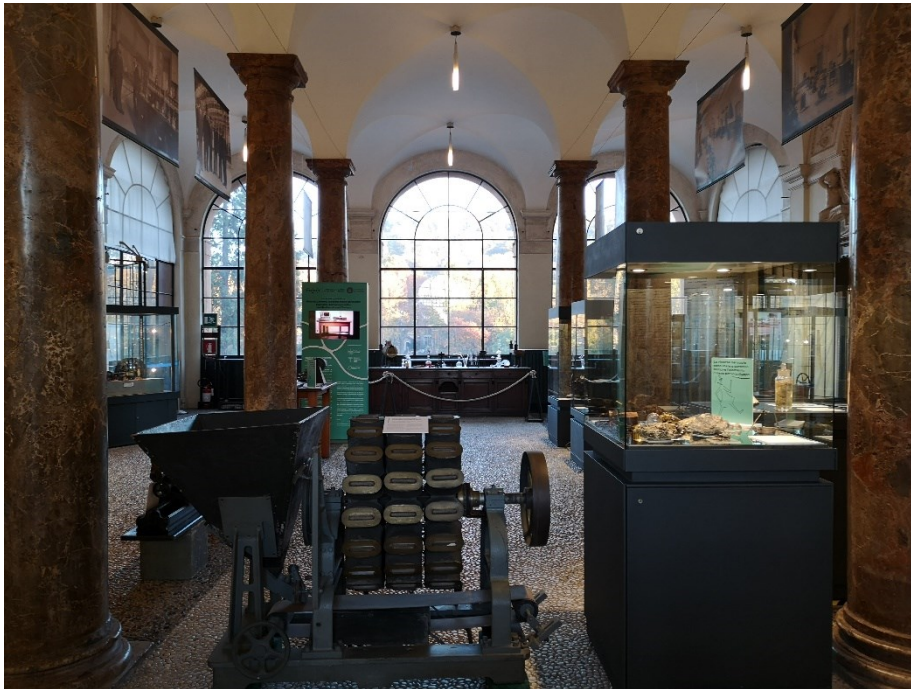
Fig. 1 Veduta d'insieme della mostra. La sala Colonne.

dell'Italia moderna. “Tutto per la Scienza e colla Scienza”, è il motto vibrante usato da Pacchiotti per attestare il nuovo ruolo della Torino post-unitaria 2 .