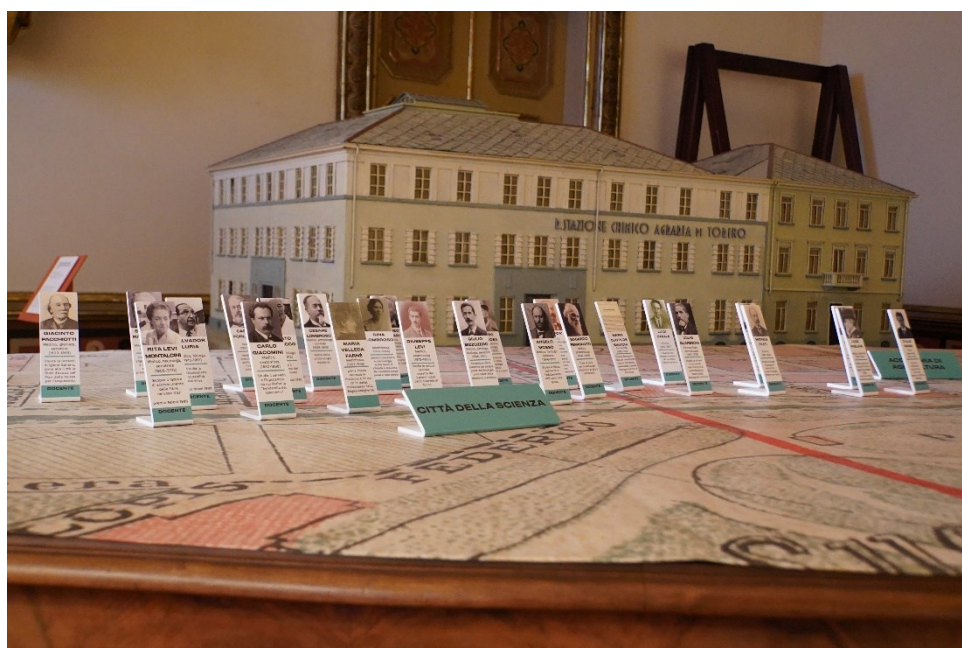
Fig. 2 Particolare della Sala Valentino. Torino città della scienza e i suoi protagonisti.

In ambito accademico due sono i fronti di istituzioni fondate con l'obiettivo di modernizzare il nuovo Regno d'Italia. Da un lato, per mezzo della Legge Casati del 1859 Quintino Sella istituisce la figura del nuovo tecnico moderno con la fondazione della Scuola di applicazione per Ingegneri, a cui si affianca, già a partire dal 1862, la nascita del Museo Industriale Italiano, tra i primi istituiti in Europa, per percorsi professionalizzanti e di alta specializzazione 4 . Dall'altro, in ambito medico-scientifico dal 1884 vengono realizzati su corso Massimo d'Azeglio i nuovi istituti universitari dedicati alla scienza medica (Anatomia e Medicina legale, Chimica e Chimica farmaceutica, Fisiologia e Patologia generale, Fisica e Igiene) con tecnologie e laboratori sperimentali all'avanguardia – fortemente sostenuti dai medici Giacinto Pacchiotti, Giulio Bizzozero e Luigi Pagliani già a partire dal 1876 – che, per imponenza di impianto e novità, vengono riconosciuti in tutta Italia come “Città della Scienza” 5 .