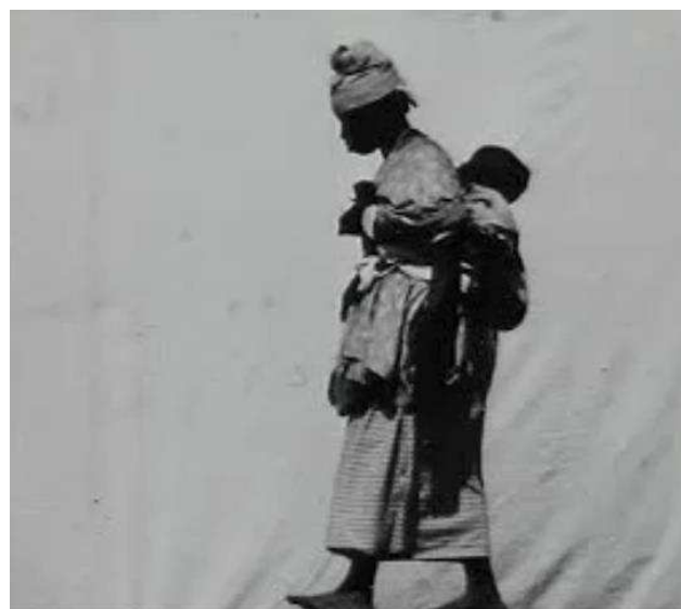
2. Imagen tomada por Felix Regnault, por medio del cronofotógrafo de Marey, y presentada en 1895 durante la Exposición Etnográfica del África Occidental. En ésta se observa una mujer que, sustraída de su entorno, deambula junto a su niño/a por la Station Physiologique de Marey.

Godard en su Godard par Godard que Marey, escuchando sobre la invención de los hermanos Lumière dijo: “Es completamente imbécil. ¿Por qué filmar a la velocidad normal eso que vemos con nuestros ojos? No veo cuál podría ser el interés de una máquina ambulante”. 21 Las dos instancias implicarían, de alguna forma, una relación distinta en la organización y frucción discursiva presentes en las prácticas cronofotográficas.