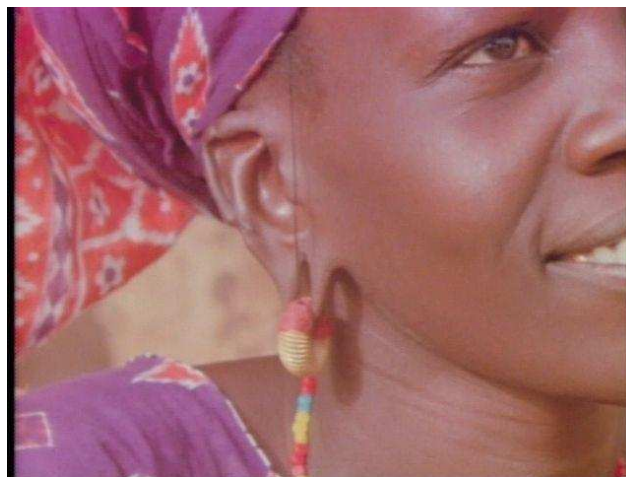
3. Close-up de una de las mujeres que aparecen en Reassemblage (1982) de Trinh T. Minh-ha. En el audiovisual se busca poner en crisis las políticas de representación etnográfica del/a “otro/a” construyendo imágenes que cuestionen la pretensión de objetividad analítica y descriptiva de las ciencias y de sus prótesis y juguetes de registro.