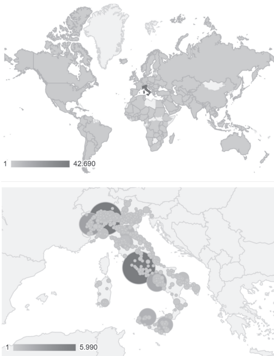
Fig. 2. Mappe geografiche con i Paesi del mondo e le località italiane da cui sono avvenute le connessioni al sito web del LFSAG dal 1° gennaio al 31 dicembre 2021 [da < http://www.google.com/analytics/ >].

Il Responsabile scientifico del LFSAG ANTONIO ROMANO