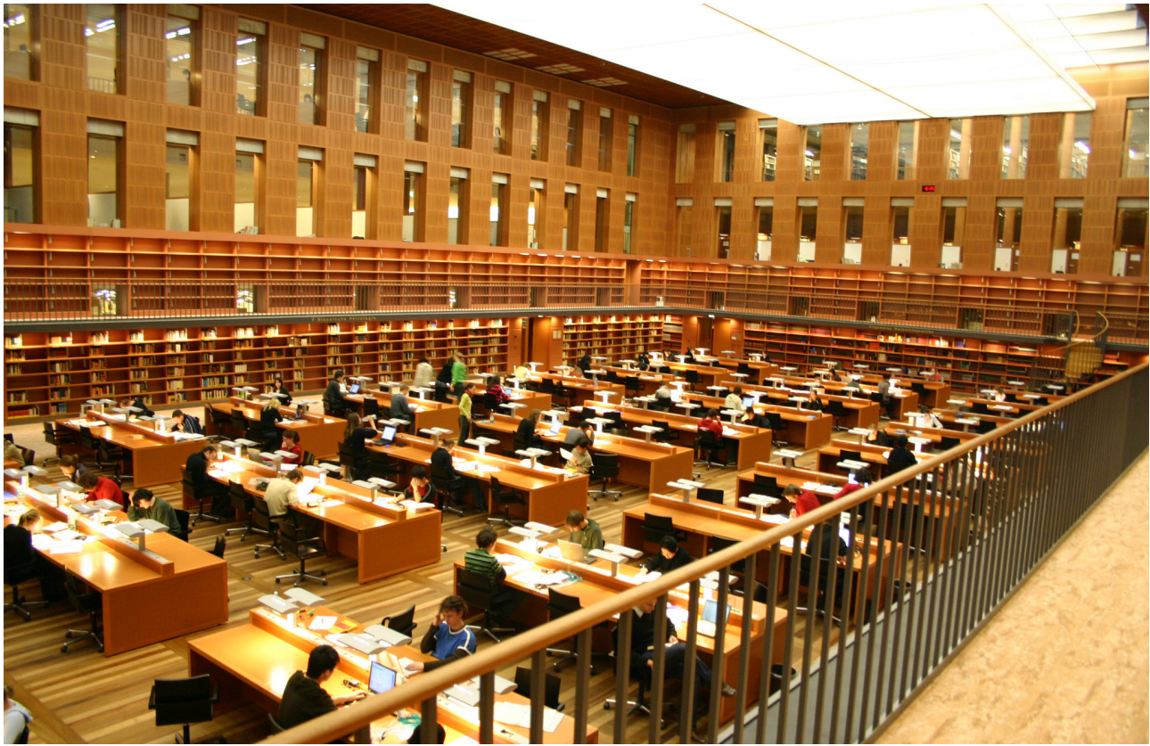
Sächsische Landesbibliothek- Staats- und Universitätsbibliothek (Dresda)

i principali fornitori di e-book a livello internazionale, tra cui EBSCO 76 e ProQuest 77 , e anche con fornitori che si dedicano esclusivamente al mercato editoriale di lingua tedesca, come Ciando 78 . Le biblioteche hanno sperimentato anche dei modelli di PDA sviluppati da singoli editori, tra cui è opportuno menzionare il tedesco De Gruyter 79 e l'olandese Elsevier 80 . La principale motivazione alla base delle sperimentazioni tedesche della PDA si individua nella diminuzione del budget per gli acquisti delle monografie (sia cartacee sia elettroniche) che ha indotto a ripensare e riorganizzare il collection development – soprattutto delle e-resource che, come più volte ricordato, sono carat-