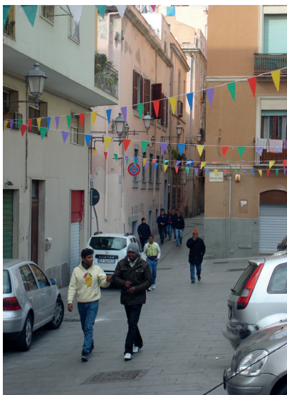
Figura 2. – Cagliari, immigrati per le vie del quartiere Marina.