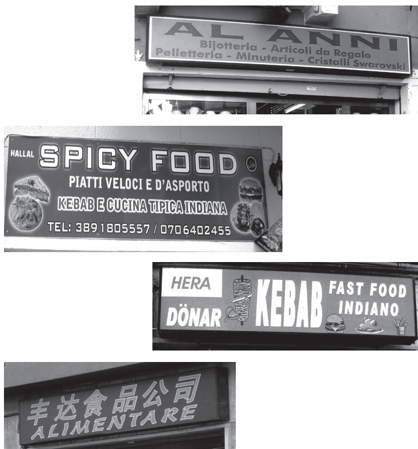
Figura 1. – Cagliari, esempi di insegne bilingui lungo le vie del centro storico.