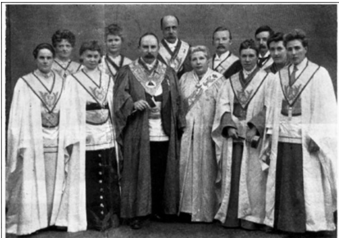
FOUNDERS OF HUMAN DUTY LODGE, No. 6 (LE DROIT HUMAIN), PREMIER LODGE IN GREAT BRITAIN, FOUNDED 26TH SEPTEMBER, 1902.