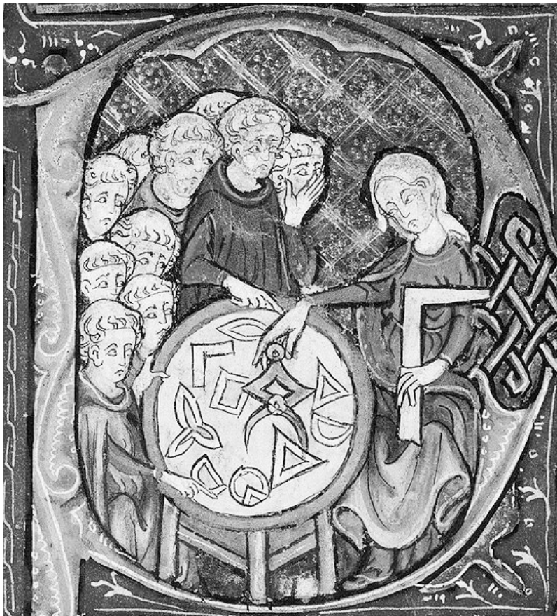
Women teaching geometry: dipinto attribuito all'artista Meliacin Master.