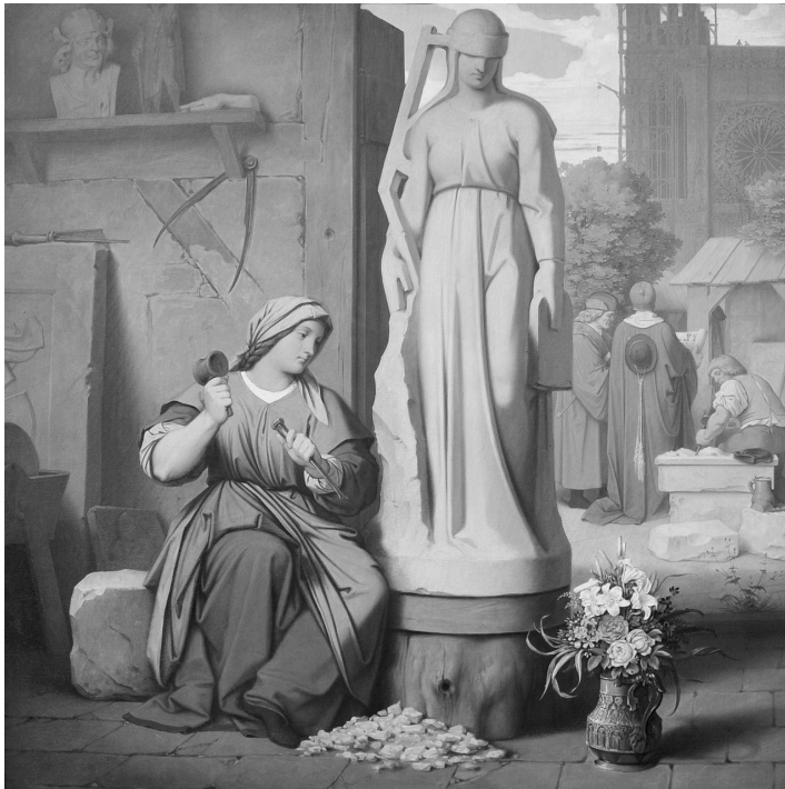
Sabina Von Steinbach, dipinto di Moritz Von Schwind, 1844.

differenziare i muratori che costruivano edifici da quelli che invece edificavano le cattedrali. È proprio su questi che si deve focalizzare la nostra attenzione, infatti, erano quasi sicuramente una sezione a parte, non legata alle norme sopra citate, poiché non avevano una fissa dimora, ma si spostavano per tutta l'Europa nei luoghi in cui dovevano costruire le cattedrali o le chiese. In alcuni casi i lavori duravano anni e da qui la ragione della costruzione delle logge, che in origine non erano altro che delle case, o capannoni, in cui si riunivano tutti i Muratori, per mangiare, riposare, discutere dell'andamento dei lavori, fare in buona misura comunità 82 . In questo clima di convivialità, collaborazione e vita in comune, affonda le sue radici quella che noi oggi definiamo Massoneria operativa. Le regole del mestiere sono diventate regole morali, e da qui origina tutto il discorso dell'operatività.