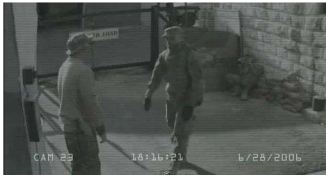
Figuras 12 y 13

La pulverización de la mirada y la proliferación de los puntos de vista que habilita la comunicación digital parecerían conllevar una hiperobjetivación de la realidad por medio de una presunta transparencia. Sin embargo, la construcción enunciativa de los planos nos muestra que a una otredad inexistente no puede más que seguir una subjetividad inexistente. La ideología de la transparencia, incorporada tanto por el sitio web como por la grabación del circuito cerrado de vigilancia, contribuye a la construcción de miradas funcionales a los dispositivos impuestos por la razón bélica. Por ello, la enunciación en Redacted nos enfrenta a un simulacro de subjetividad o mejor aún, a su ilusión.