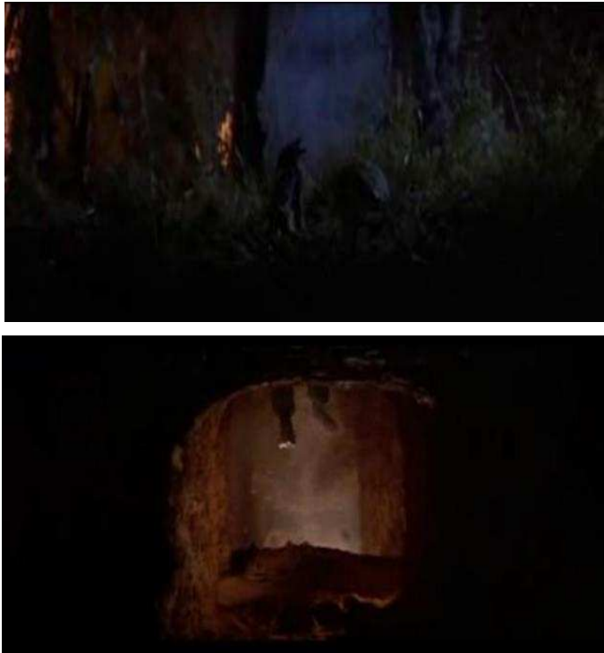
Figuras 7 y 8

¿Qué significa caer en la mitad? Además, ¿cómo es representado este pasaje desde un mundo hacia el otro? Arriba, en la superficie, se muestra a los estadounidenses y abajo están los enemigos. Esta específica repartición del mundo en la pantalla no implica tanto la valorización morfosintáctica de arriba=buenos versus abajo=malos; cuanto, más bien, una valorización plástica del enunciado filmico.