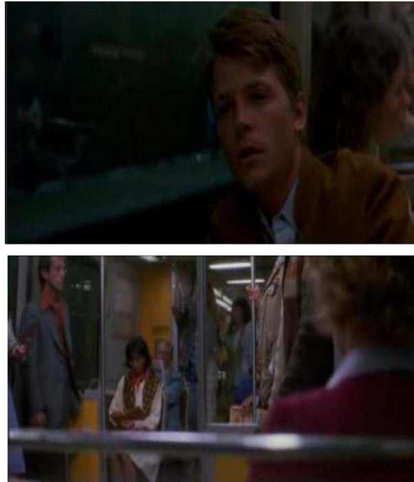
Figuras 5 y 6

¿Qué relación enunciativa se ha construido en estos pocos segundos? ¿Quién es el sujeto y quién es la otredad? El intertítulo inicial nos había informado que se iba a hablar de la Guerra de Vietnam pero, mirando detenidamente, parece que el objetivo del director en estos primeros planos es mezclar la retórica bélica para minar, desde adentro, el estereotipo del género: no hay valientes soldados, sino soñadores turbados; no hay gloria ni campos de batalla sino la normalidad urbana, y tampoco hay enemigos, sino jóvenes estudiantes. Pero sí hay algo: un movimiento de cámara cuyo rasgo incorporado une las oposiciones enunciativas del campo y contracampo, un movimiento que podríamos definir indócil y que funciona como destello de la enunciación.