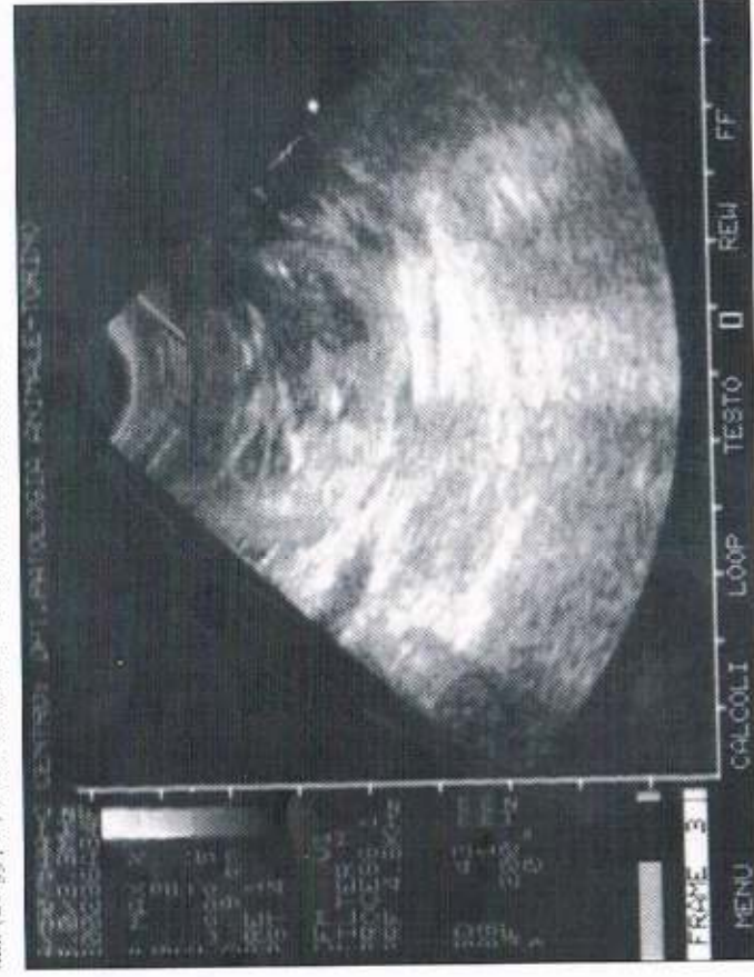
Figura 2 Cane femmina incrociata maremmano di 5 anni, immagine ecografica della degenerazione embrionale (33 gg pa) 24 ore dopo il terzo ed ultimo trattamento con cloprostenolo.