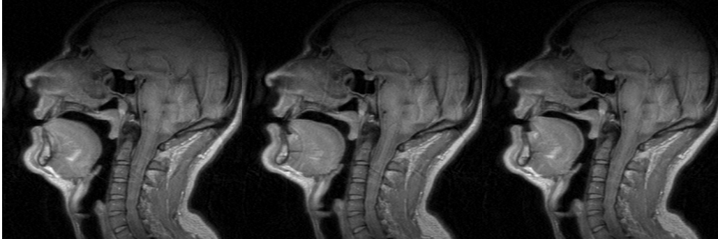
Figura 2 - IRM (Immagini per Risonanza Magnetica) corrispondenti al momento occlusivo per tre suoni sordi pronunciati dall'autore: a) affricata apico-dentale+predorso-alveolare [ts] (a sinistra); b) affricata apico-(post)alveolare (labializzata) [tʃ] (al centro); c) retroflessa [tʃ̺] (a destra). Le tre consonanti sono state pronunciate lunghe in un contesto di invariabilità vocalica ("azza" [atːsa], "accia" [afːʃa] e "at̪ta" [ʔ]) [per queste immagini ringrazio P. Badin dell'ICP e il CHRU di Grenoble].

Sulle caratteristiche articolatorie nel piano sagittale-mediale delle quattro affricate per un locutore di origini salentine, si veda la Fig. 2 che mostra, per le due sorde, a sinistra, l'articolazione corrispondente al momento occlusivo dell'affricata [ts], che possiamo così definire, apico-dentale+predorso-alveolare , e a destra quella corrispondente al momento occlusivo dell'affricata [tʃ] che non possiamo quindi ritenere né palatale, né prepalatale, né mediopalatale, ma tutt'al più apico-postalveolare (labializzata) .