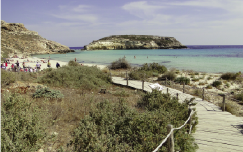
Fig. 7 — Accesso obbligato in spiaggia (foto G. Nicolini).

Con il descritto programma di interventi, è stato centrato l'obiettivo specifico della riduzione-mitigazione dei fenomeni di dissesto idrogeologico che alteravano la naturalità del sito e del recupero ambientale di tutta l'area della spiaggia dei Conigli, conseguendo un sensibile miglioramento delle condizioni necessarie per la nidificazione di Caretta caretta .