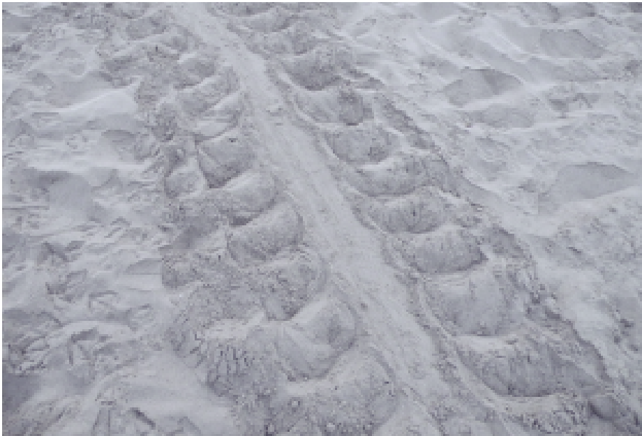
Fig. 14 — Tracce di Caretta caretta.

Tre femmine nidificanti sono state marcate dall'inizio del programma di monitoraggio notturno: una nel 2004, due nel 2006. Nel 2009 è ritornata a