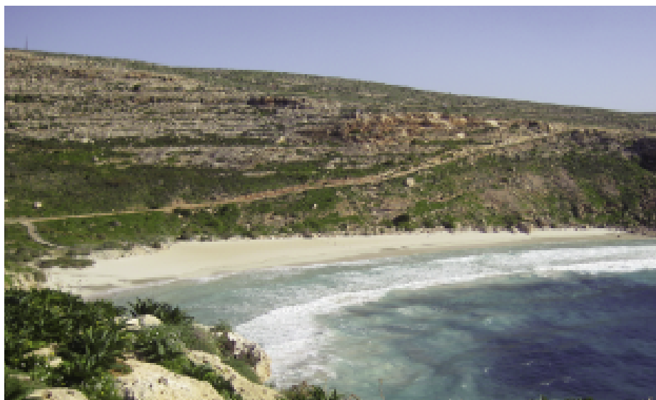
Fig. 2 — Il versante dopo i lavori di recupero ambientale.