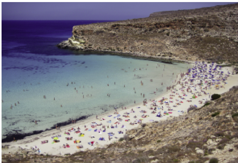
Fig. 8 — La suddivisione della spiaggia in due settori, con l'area destinata alla collocazione degli ombrelloni.