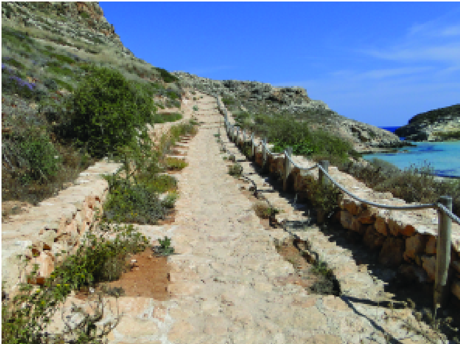
Fig. 4 — Il nuovo percorso di accesso pedonale alla spiaggia.

Nell’ambito dei suddetti interventi sono state anche presidiate con tratti di recinzioni tutte le aree sensibili della spiaggia e del soprastante versante, in modo da eliminare i danni da calpestio incontrollato ed indirizzare la fruizione lungo percorsi obbligati (Fig. 7).