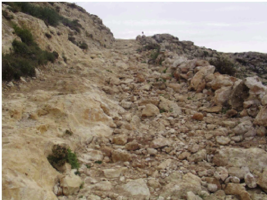
Fig. 3 — Il percorso di accesso alla spiaggia prima dei lavori.