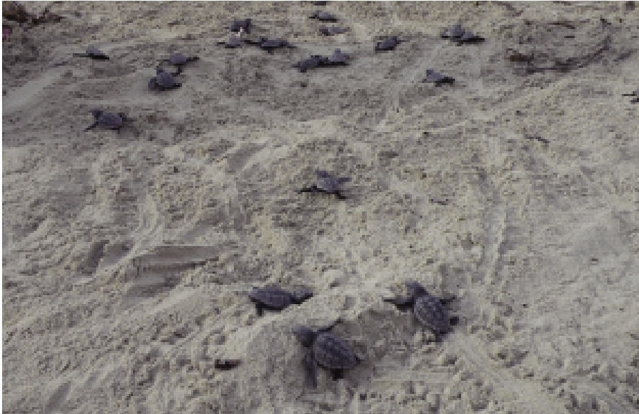
Fig. 15 — Piccoli di Caretta caretta in corsa verso il mare.