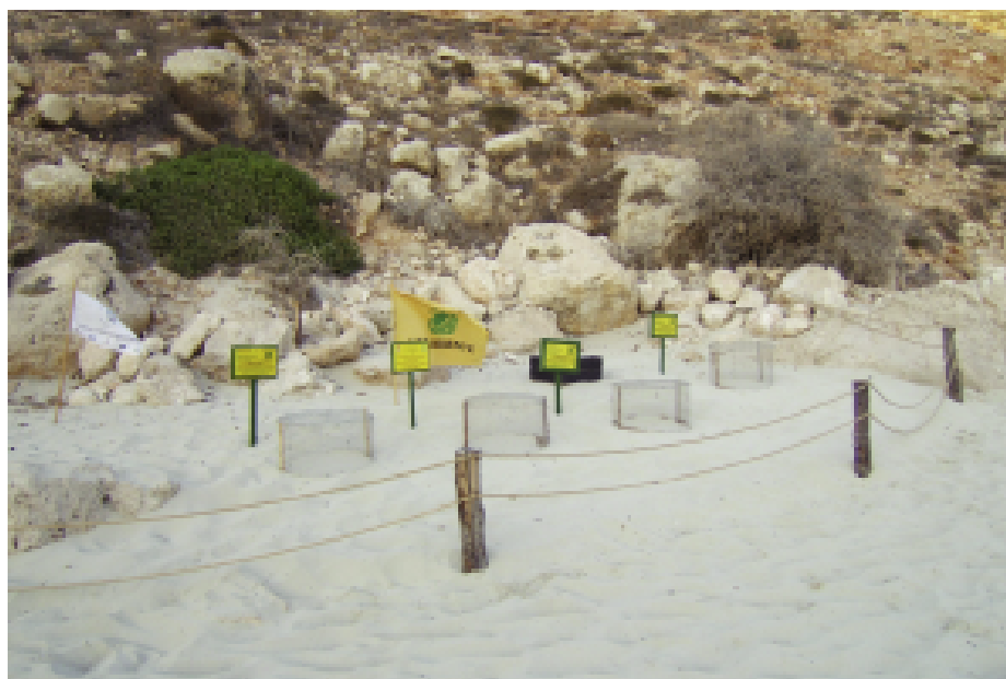
Fig. 9 — L'area di traslocazione dei nidi.