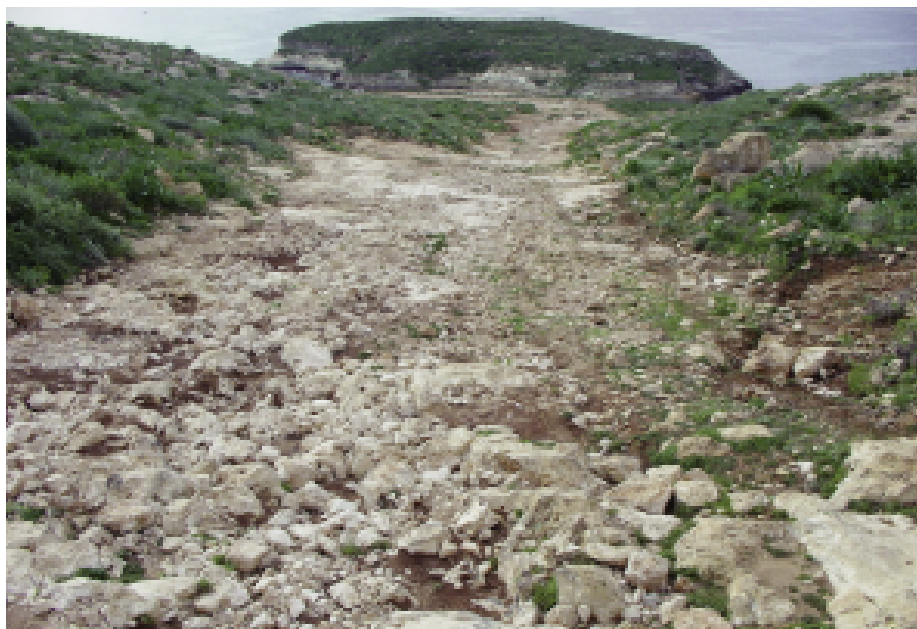
Fig. 5 — Il primo tratto della pista di accesso alla baia prima dei lavori.