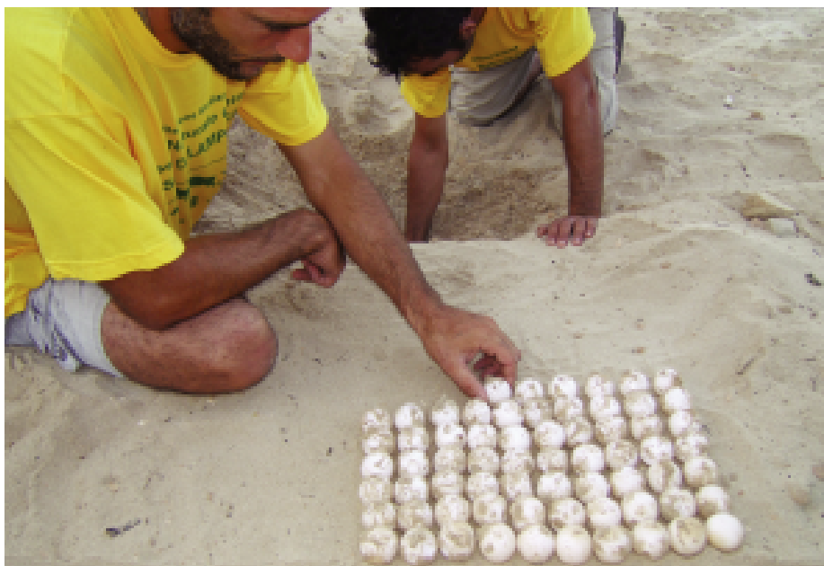
Fig. 11 — Traslocazione di un nido di Caretta caretta.