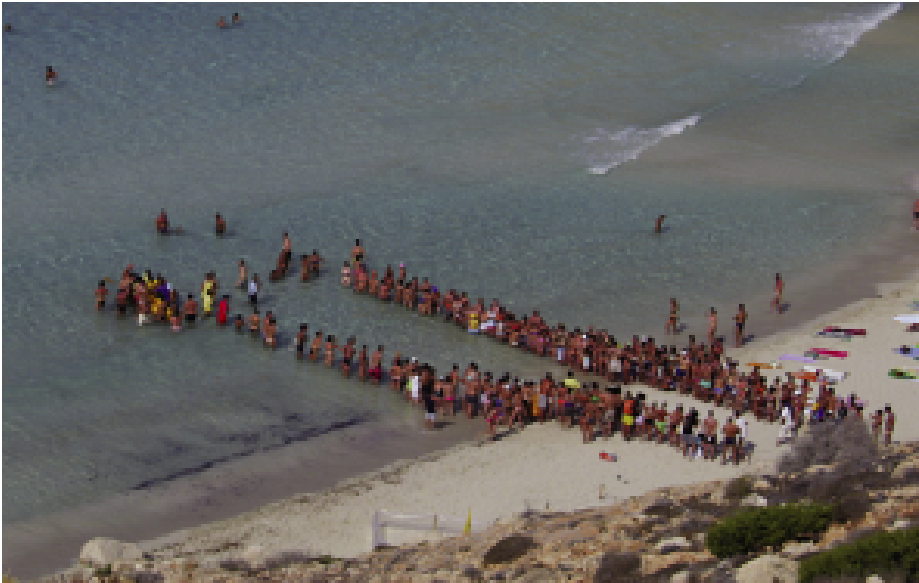
Fig. 17 — Una schiusa diurna.

Nel 28% dei casi la schiusa è avvenuta di giorno, quando la spiaggia era affollata di bagnanti ed erano presenti numerosi gabbiani, che generalmente popolano la baia e l'antistante isolotto dei Conigli, rendendo quindi necessari ulteriori accorgimenti. Le acque basse e cristalline che caratterizzano la baia dei Conigli aumentano, infatti, le possibilità per i neonati che vi si immergono in orario diurno di essere avvistati e predati dai gabbiani, mentre ancora nuotano a pelo d'acqua per allontanarsi e raggiungere il mare aperto. In questi casi, le piccole tartarughe, una volta raggiunto il mare, sono scortate per mezzo di una canoa fuori dalla baia. Durante le schiuse diurne, il personale della Riserva Naturale e i volontari delimitano un ampio corridoio protetto fino al mare, al fine di rendere possibile la traversata in sicurezza dei neonati sulla spiaggia, e nello stesso tempo provvedono ad informare i visitatori sui comportamenti da adottare per assistere all'avvenimento senza arrecare danni e limitare al massimo il disturbo costituito dalla presenza umana sulla spiaggia. Il pubblico è così coinvolto nelle operazioni di assistenza alla schiusa, non intralcia il percorso dei piccoli, ma anzi acquista la diretta consapevolezza dell'elevato valore conservazionistico dei luoghi e dell'importanza delle azioni di tutela della natura (Fig. 17).