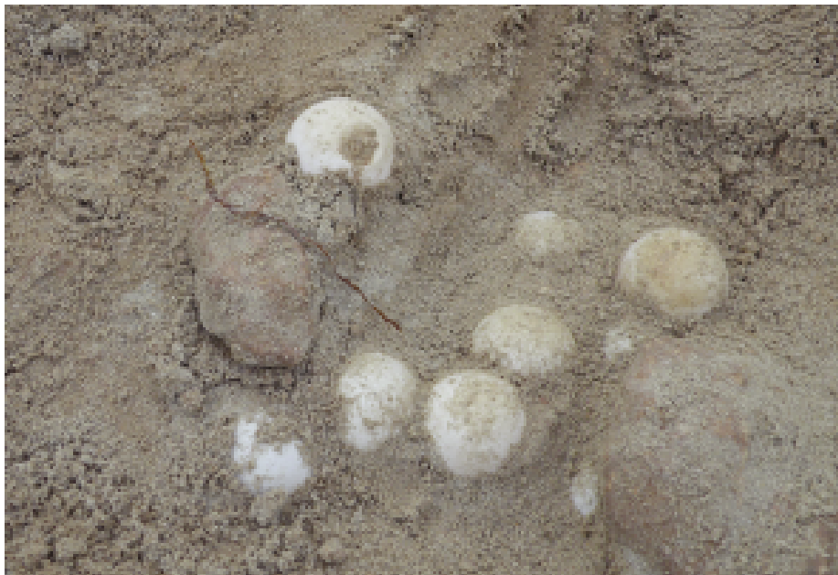
Fig. 10 — Nido a rischio per la presenza di pietre, terriccio e radici.