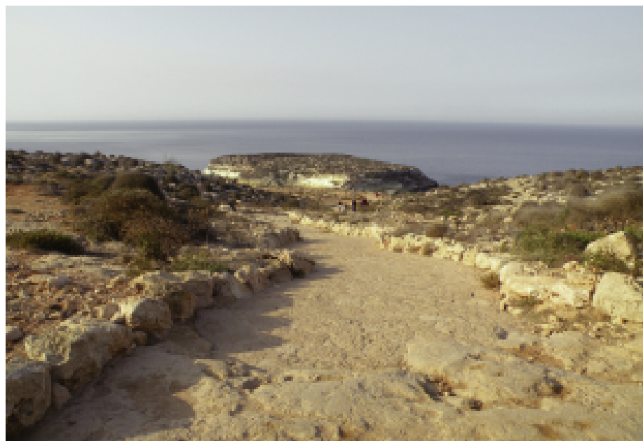
Fig. 6 — Il nuovo percorso di accesso alla baia dei Conigli.