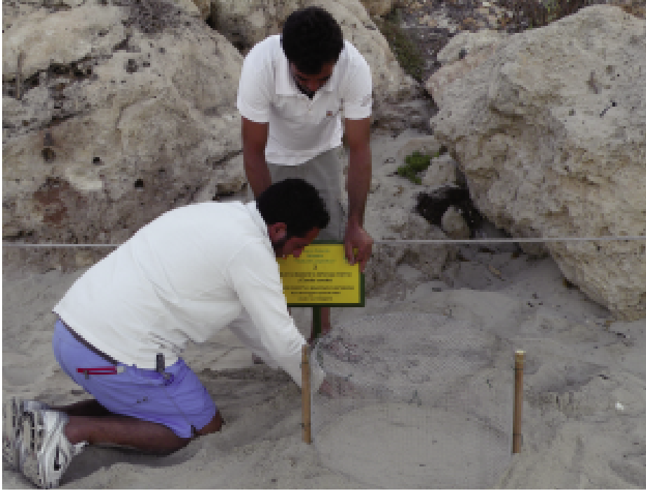
Fig. 12 — Protezione e segnalazione di un nido di Caretta caretta.

I descritti interventi di protezione, insieme alla costante opera di sensibilizzazione nei confronti dei fruitori della spiaggia, eliminando le minacce specifiche, hanno effettivamente contribuito a garantire la conservazione di Caretta caretta e ad aumentarne il successo riproduttivo.