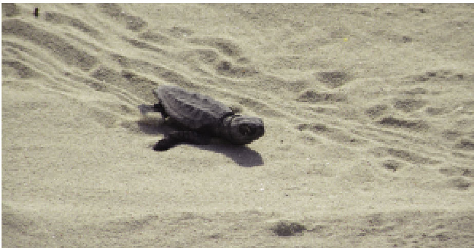
Fig. 16 — Piccolo di Caretta caretta.

mente ogni tartaruga che emerge. Per fare in modo che le attività di rilevamento scientifico interferiscano il meno possibile con la naturalità dell'evento, è necessario procedere alla raccolta dati sul campo in progressione con la