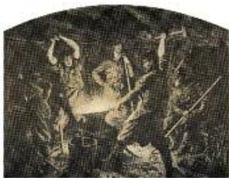
Si forgiavano le armi , illustrazione dal ciclo di Artur Grottger (1837-1867) dedicato all'insurrezione del 1863.

L'insurrezione si protrasse fino all'autunno del 1864. Dei duecentomila soldati che vi presero parte trentamila perirono e decine di migliaia furono deportati in Siberia.