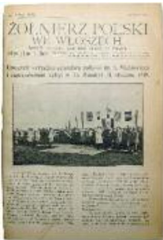
“Żołnierz Polski we Włoszech”, n.2, 14 febbraio.

Il occasione del giuramento del reggimento Adam Mickiewicz il 31 gennaio 1919 uscì il primo numero del giornale da campo “Żołnierz Polski we Włoszech”, il primo periodico in lingua polacca edito in Italia di cui si sono conservati degli esemplari (della “Dekada Legionowa” edito a Mantova nel 1797 non si è salvata neppure una copia); veniva stampato a cadenza bisettimanale nella tipografia dei Salesiani di Torino.