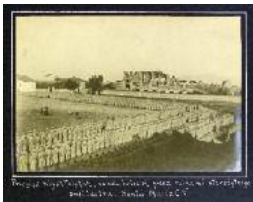
Rassegna dei reparti al campo di Santa Maria Capua Vetere

Su pressione dei delegati romani del "KNP" e dei governi alleati, le autorità italiane accettarono di raggruppare i prigionieri po-