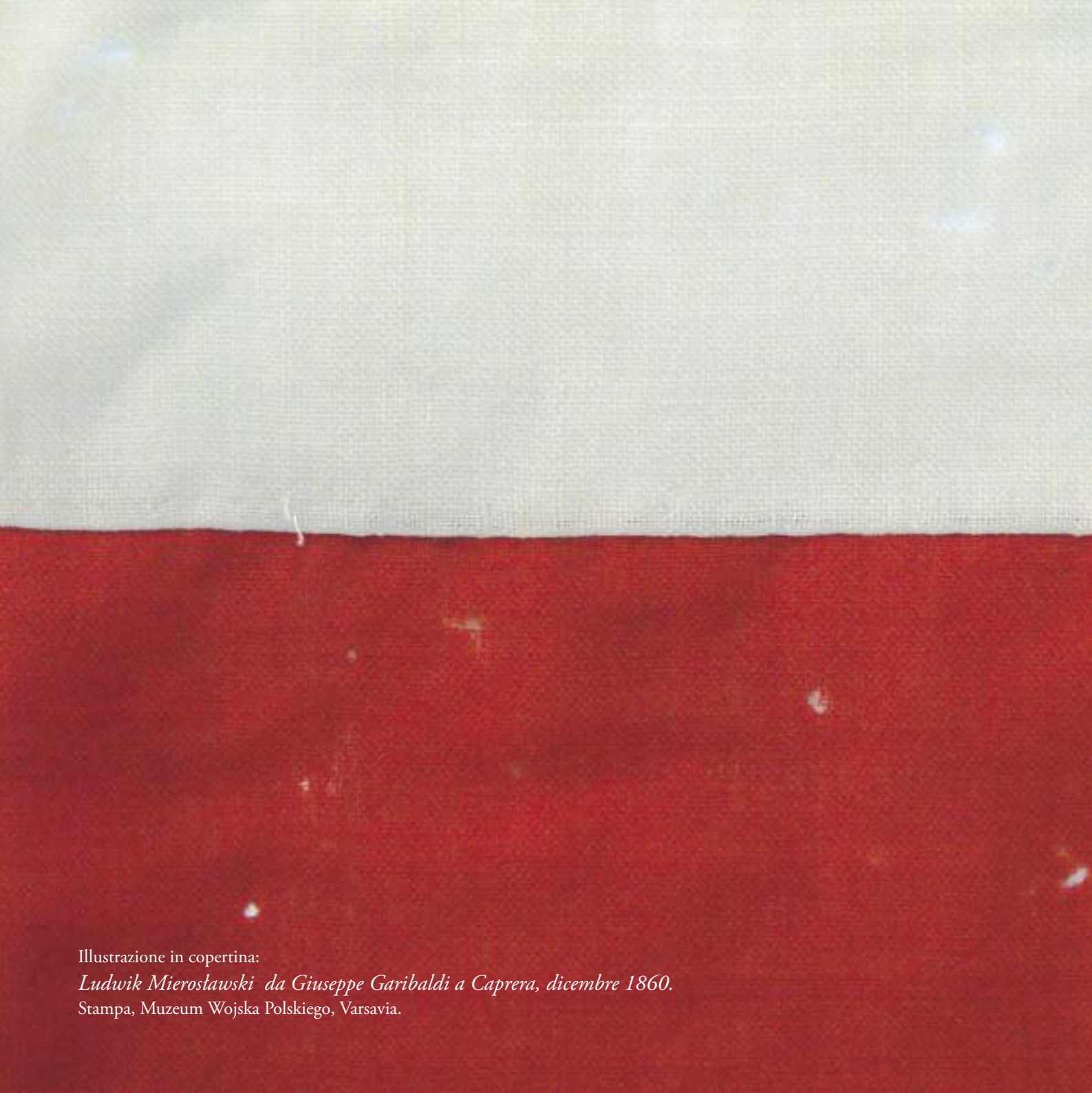
Illustrazione in copertina: