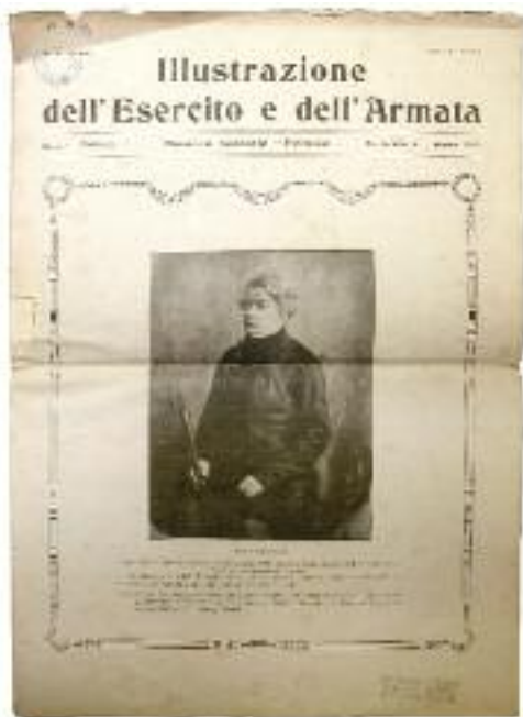
Sopra: «Illustrazione dell'Esercito e dell'Armata», Numero Speciale "Polonia", Marzo 1919

Biblioteca Begey, Biblioteca del Dipartimento di scienze del linguaggio e letterature moderne e comparate, Università di Torino.