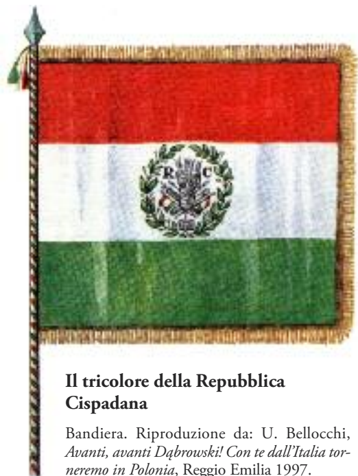
Il tricolore della Repubblica Cispadana

de popolarità. In esso trovava espressione la fede nella rinascita della Polonia grazie all'impegno dei polacchi che combattevano per gli ideali repubblicani in Italia e che da qui avrebbero raggiunto e liberato la propria patria.