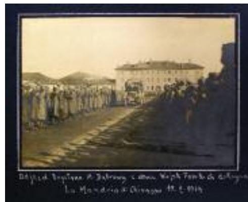
Gita a Pompei da Santa Maria Capua Vetere

Fondo Begey, Museo Nazionale del Risorgimento, Torino.