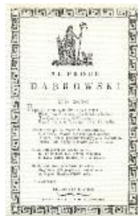
Luigi Cagnoli, Al prode Dąbrowski , Reggio Emilia 1797.

Stampato. Riproduzione da: U. Bellocchi, Avanti, avanti Dąbrowski! Con te dall'Italia torneremo in Polonia , Reggio Emilia 1997.