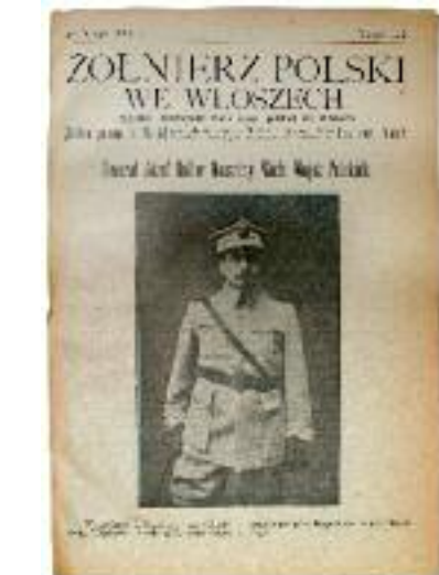
“Żołnierz Polski we Włoszech”, n. 3, 20 febbraio 1919.

Mediamente composto di otto pagine in ottava, con rare illustrazioni, veniva distribuito tra i soldati del campo, e alcuni esem-