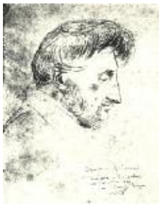
Joachim Lelewel (1786-1861). Storico, a lui si deve presu-