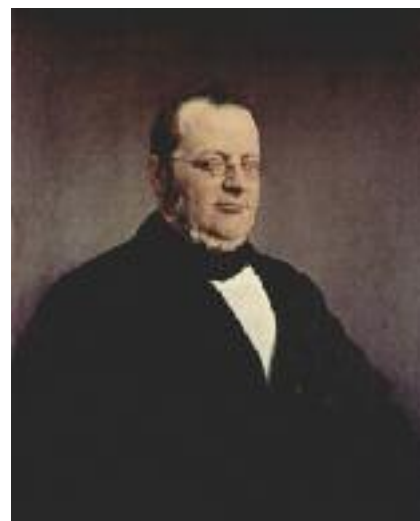
Camillo Benso conte di Cavour.