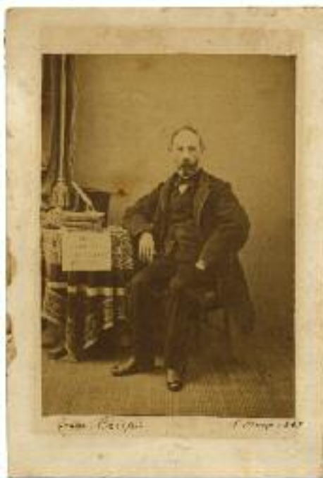
Francesco Crispi , Fotografia fatta il 15 marzo 1863 in occasione di una manifestazione per la Polonia. Sul tavolo si vede un foglio con la scritta: “Viva la Polonia e la fratellanza dei popoli”.