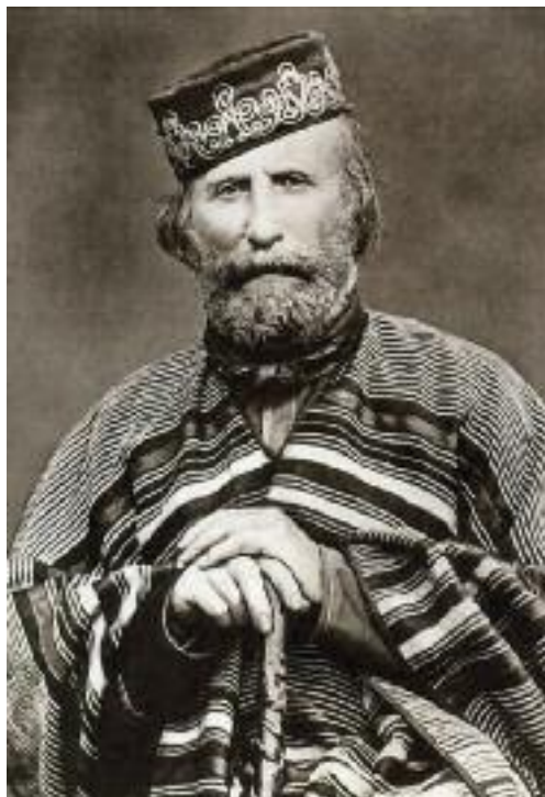
Giuseppe Garibaldi