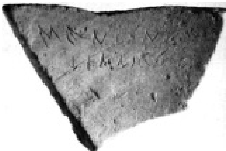
Fig. 2 - Uno degli ostraka di Menon Gargettios Lemnios , dal Ceramico di Atene (da WILLEMSSEN 1965)

in una lista di magistrati locali databile intorno al 550 a.C. 95 . Significativamente, in un'iscrizione conservata sulla base di una dedica ad Eracle del 520 a.C. circa, egli si vanta di aver esercitato un' arche sia nella madrepatria, cioè a Paros, che a Thasos 96 . I commentatori hanno avanzato le ipotesi più disparate per spiegare la sua evidente 'doppia cittadinanza': sympoliteia , isopoliteia , fino anche a ventilare l'eccezione. La soluzione più facile sarebbe forse quella di pensare ad una cittadinanza non distinta, una situazione vale a dire non troppo diversa da quella che si propone qui per gli Ateniesi andati in Chersoneso con Milziade il Vecchio e poi passati a Lemno, presumibilmente nella generazione successiva, con Milziade il Giovane.