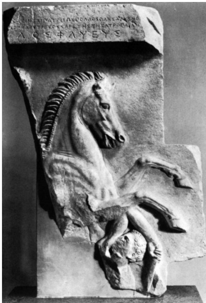
Fig. 4 - Frammento della stele di [--]ylos Phlyeus , da Chalandri (da CLAIRMONT 1970)

desime battaglie di Corinto e della Beozia e, possibilmente, anche allo stesso monumento in cui erano commemorati i cavalieri dell' Akamantis 114 .