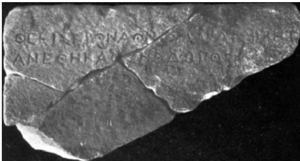
Fig. 5 - Dedicava votiva di Athenodoros del demos di Oa, dal Kabirion di Efestia (da ACCAME 1941-43)

nel demos di Phlya. La perdita dell'unico frammento sopravvissuto dell'iscrizione lemnia purtroppo preclude oggi la possibilità di precisare la forma della stele 118 . Anche in assenza del rilievo, tuttavia, l'epigramma basta evidentemente ad evocare i monumenti del Dromos .