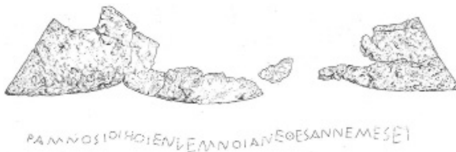
Fig. 1 - L'elmo di Ramnunte (da PETRAKOS 1999)

La continuità nella microstoria di singole cellule insediative come Paracheiri e Rossopouli assume evidentemente un valore maggiore se letta sullo sfondo di altre continuità, per esempio, nella normativa fiscale e, quindi, presumibilmente, nell'organizzazione produttiva della chora lemnia ai fini dello sfruttamento delle sue risorse a vantaggio di Atene 85 .