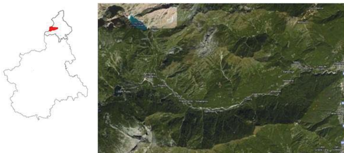
Figure 1 : Contexte géographique de la vallée Antrona : à gauche, localisation à l'échelle du Piémont ; à droite, vue satellitaire de la vallée Antrona.

L'Ossola est un ensemble de vallées dans la province de Verbano-Cusio-Ossola, située à l'extrémité nord du Piémont, qui confine à l'Ouest, au Nord et à l'Est avec la Suisse et au Sud avec la Valsesia. Le territoire de la vallée de l'Ossola correspond au bassin de la rivière Toce et est divisé en sept vallées, y compris la vallée Antrona, dans les Alpes Pennines (figure 1).