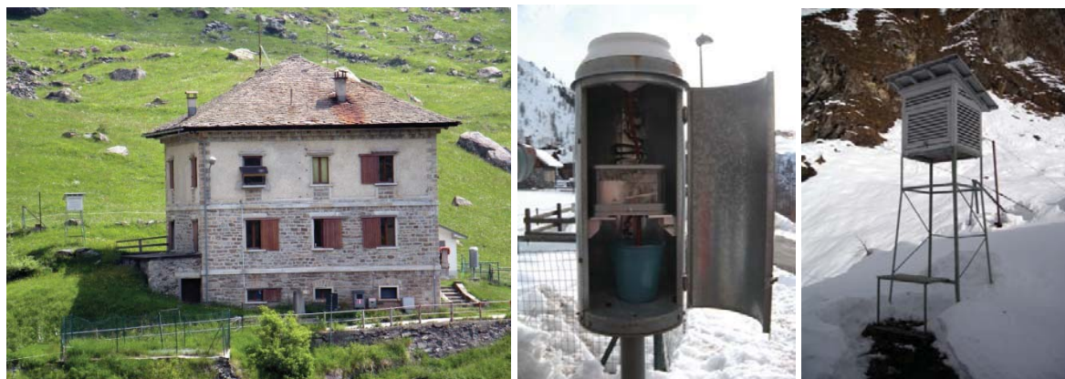
Figure 2 : A gauche : station de Alpe Cavalli située près de la maison des opérateurs du barrage ; en centre : le pluviographe à bascule, situé sur le côté Sud ; à droite : le poste climatologique, situé sur le côté Nord.

L'étude de la variabilité climatique dans la haute vallée Antrona a été réalisée à partir des données de la station de l'Alpe Cavalli (1500 m), située dans le village de l'Alpe Cheggio (46°05' / 08°07'). La station a été installée en 1928 suite à la construction d'un barrage par la société Edison. Il s'agit d'une station nivométéorologique manuelle, avec un thermomètre à maximum et à minimum, un pluviographe, une barre graduée fixe pour mesurer la hauteur du manteau neigeux et une tablette de bois pour la quantité de neige fraîche.