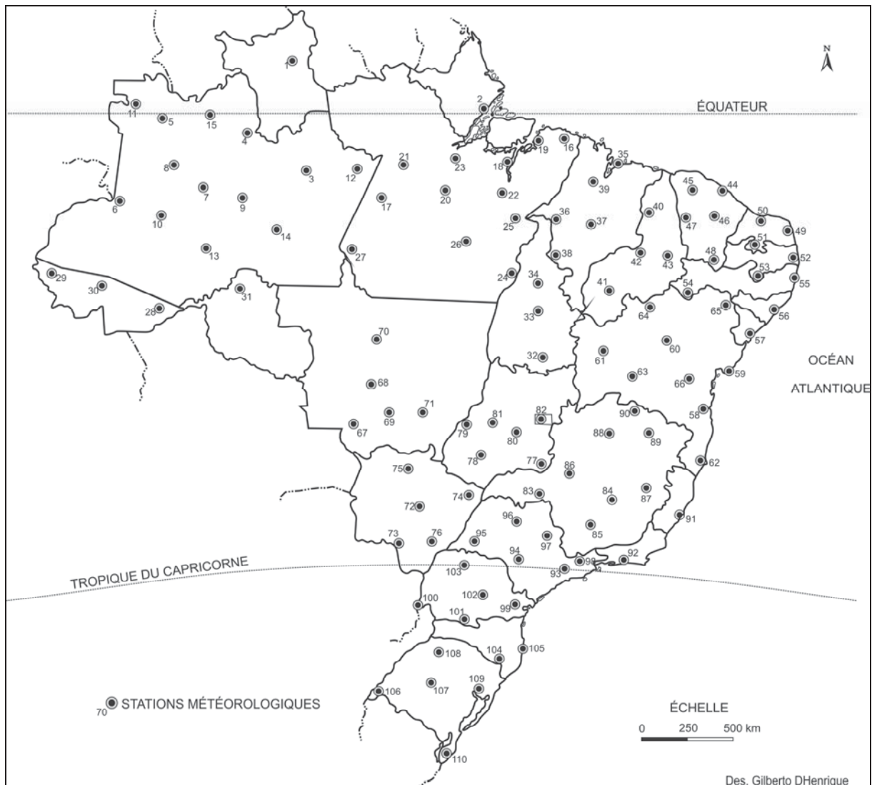
Figure 1 : Le réseau météorologique brésilien utilisé dans cette étude.

Au cours de la deuxième étape, nous avons choisi les 110 stations avec la meilleure répartition géographique sur le territoire brésilien, c'est-à-dire, la répartition la plus homogène possible, mais cela n'a pas empêché l'existence de "manque d'informations", comme l'illustre la Figure 1.