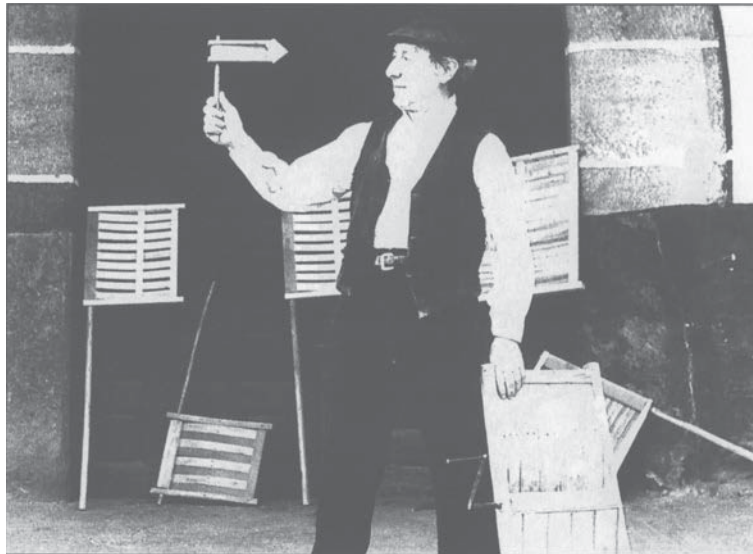
Figura 2. Le matracas di Castiglia e León

dal Giovedì Santo fino alla Domenica di Resurrezione. Essi vengono dunque trasformati da strumenti musicali in strumenti penitenziali e macchiati con il sangue dei suonatori (Fig. 3). Il significato anagogico della rappresentazione processionale della Passione di Cristo è sostituito dalla raffigurazione spettacolare della sua corporeità. Il corpo che la struttura percettiva della liturgia cattolica tende a spiritualizzare subordinando i sensi, e soprattutto il tatto e il gusto, alla parola e al miracolo della transustanziazione, riappare drammaticamente in quelle processioni religiose che, specialmente nella Semana Santa spagnola, sovvertono la gerarchia dei sensi.