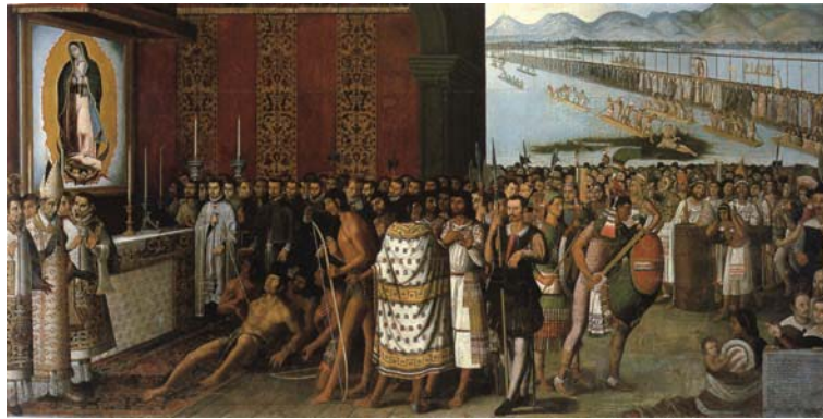
Figura 9. Traslazione dell’immagine della Vergine della Guadalupe nella sua prima cappella e miracolo , anonimo, 1653, olio su tela, cm. 285 x 595, collezione Museo de la Basílica de Guadalupe.

Una delle immagini più eleganti dell’arte coloniale mesoamericana, eseguita da un pittore anonimo dopo il 1653, narra visivamente l’incidente e il miracolo (Brown 1999, p. 21) (Fig. 9).