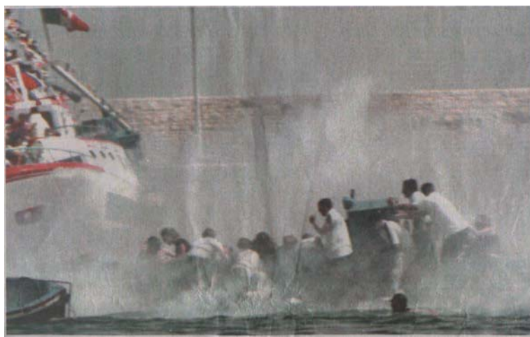
Figura 1. Incidente durante la processione marittima in onore di San Nicola a Bari l'8 maggio 2003.

bagliori, assordati dagli scoppi, storditi dalle grida degli altri fedeli e dalle esclamazioni degli spettatori — “è un attacco terrorista!” —, e dai megafoni dei pompieri.