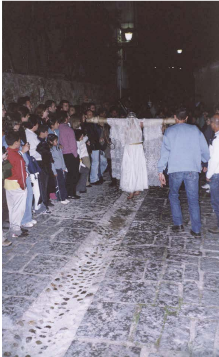
Figura 5. Un empalao per le strade di Valverde de la Vera.

ginata dopo l'espulsione degli ebrei dalla penisola iberica nel 1492. Attraverso questo rituale, i conversos (gli ebrei che avevano deciso di