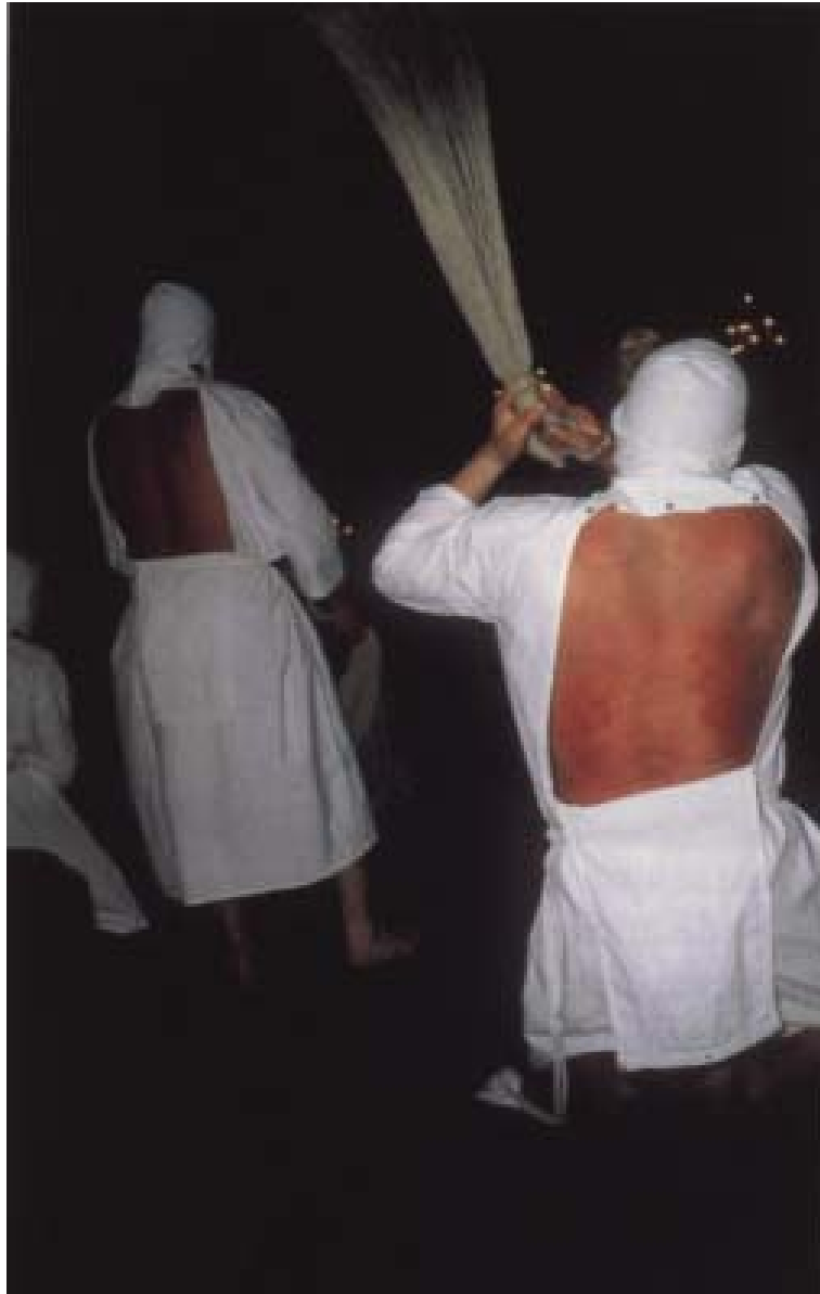
Figura 6. I picaos di San Vicente de la Sonsierra.

lactée (“La via lattea”) (1969), graffiante parodia della religiosità popolare spagnola, così come da certi passaggi del romanzo di José Saramago Memorial do Convento (1982). Un’eco di essa si trova anche ne Le Rouge et le Noir di Stendhal.