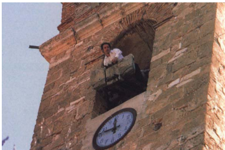
Figura 4. “Volteggiatore” di Castielfabib.

ta dall'equilibrio collettivo del rituale e della sua liturgia. Le campane cessano di essere uno strumento acustico per la creazione di un'agentività collettiva e divengono strumento ludico per il divertimento di un'agentività individuale (e per la costituzione del suo pubblico).