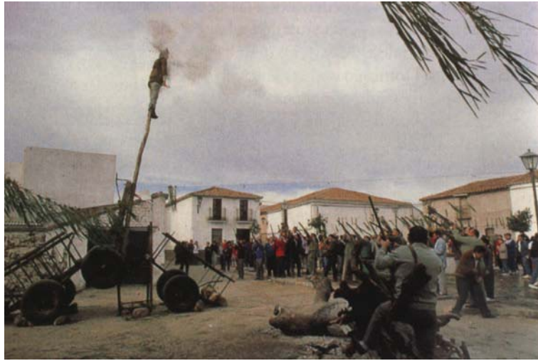
Figura 7. Fucilazione di Giuda ad Aldea de Cuenca.

violenta per rogo tocca invece a Giuda ad Alfaro, nella Rioja, o in Estremadura. Qui il pupazzo del traditore spesso mostra i caratteri di questo o quel personaggio politico “cattivo” (nel 2003, per esempio, il Giuda di Torremenga de la Vera, in Estremadura, aveva il semblante di Saddam Hussein). Di nuovo, la contingenza geo-politica della messa in scena inevitabilmente ne diminuisce l’atemporalità liturgica: Giuda non è più il simbolo cosmico della tragica scelta con cui gli uomini rigettano la visita del sacro, ma il capro espiatorio del senso di appartenenza collettiva degli abitanti del villaggio al loro ambiente profano (Girard 1982). Da questo punto di vista, i rituali della messa a morte di Giuda sono tutti reminiscenti di quelli in cui, in epoca pre-cristiana, si simbolizzava l’espulsione dell’inverno e, quindi, della morte, al di fuori del perimetro del villaggio.