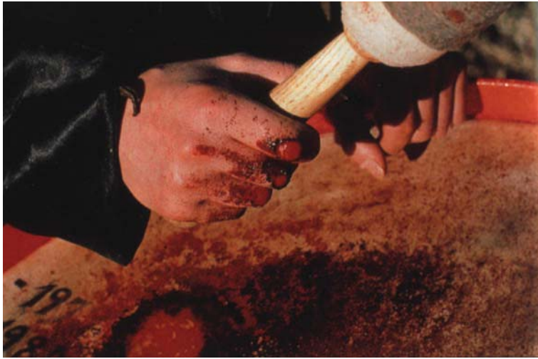
Figura 3. Uso penitenziale dei tamburi durante la Semana Santa di Híjar.

spiritualità della liturgia adottando regimi sensoriali che assomigliano a quelli del gioco.