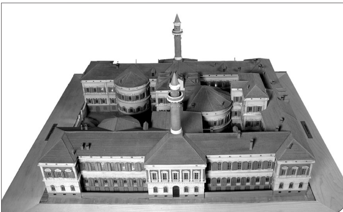
Fig. 1. Plastico del Palazzo degli Istituti Anatomici dell'Università di Torino in cui sono ospitati il Museo di Anatomia umana "Luigi Rolando", il Museo di Antropologia criminale "Cesare Lombroso" e il Museo della Frutta "Francesco Garnier Valletti" (modello realizzato da René David in scala 1:100; lunghezza reale della facciata m 84).

Successivamente, il 15 novembre 2001 venne firmata una convenzione tra l'Università di Torino e la Regione Piemonte che impegnò i due Enti a promuovere la riunione in quell'edificio dei tre musei citati, affiancandovi nuovi settori permanenti tra i quali un percorso espositivo sull'evoluzione fisica e culturale dell'uomo, oltre che spazi per mostre temporanee.