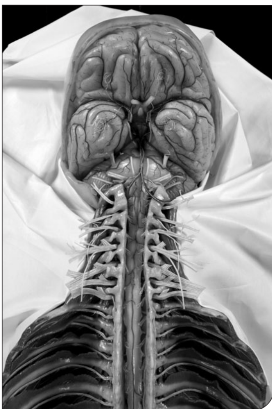
Fig. 2. Museo di Anatomia umana dell'Università di Torino, esempio di modello della collezione di ceroplastica. Francesco Calenzoli, Colonna vertebrale con encefalo, midollo spinale e nervi intercostali vista anteriormente, Firenze, c. 1830.

Nel febbraio 2002, in base a una convenzione siglata dall'Università con la Città di Torino e con l'Istituto Sperimentale per la Nutrizione delle Piante di Roma, trovò destinazione nello stesso edificio il Museo della Frutta, con la ricca collezione di modelli realizzati a fine Ottocento da Francesco Garnier Valletti (Jalla & Costanzo, 2008).