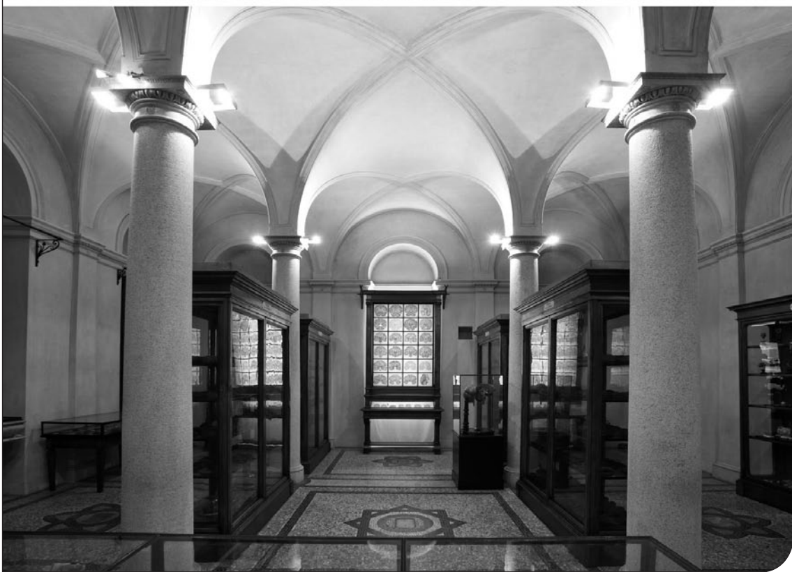
Fig. 7. Museo di Anatomia umana dell'Università di Torino. Prima e seconda sala, dopo il restauro.