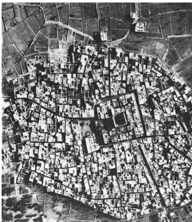
Fig. 9 - Veduta aerea di Pyrgi scattata nel 1934; è possibile individuare con chiarezza il perimetro della fortificazione circostante il torrione.

Se infatti un Sampiero di Bastelica 36 isolato, per quanto popolare, costituiva un problema di portata locale, lo stesso personaggio, inquadrato in un ben più vasto disegno di trame politico-diplomatiche, diveniva una minaccia mortale, e come è ben noto la vicenda delle peregrinazioni del ribelle corso alla ricerca di sostegni per la sua causa ebbe modo di incrociarsi, sia pur fuggevolmente, con il destino di Chio, allorché Sampiero, nel corso del suo viaggio a Costantinopoli per sollecitare, anche a nome degli alleati Francesi, un maggiore impegno del Gran Signore in soccorso dei ribelli corsi, toccò proprio il porto dell'isola egea fermandovisi per ben tre giorni, dal 24 al 26 maggio 1563.