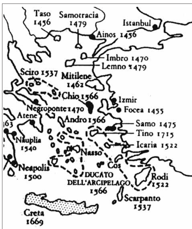
Fig. 2 - Le colonie "latine" nell'Egeo (la data si riferisce all'occupazione ottomana).

Sicuramente, una rilettura delle fonti di governo e, soprattutto, un approfondito sondaggio del copioso materiale delle filze dei notai attivi nell'isola fino all'ultimo momento della presenza genovese, ora conservato presso l'Archivio di Stato di Genova 5 , consentirà di dare una lettura più equilibrata dell'atteggiamento delle autorità genovesi, inquadrando la vicenda di Chio non solo nella specifica cornice dell'area egea, ma in quella più generale della trasfor-