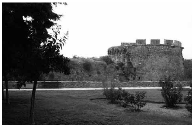
Fig. 6 - Una delle torri del fianco occidentale del Kastro di Chio; si può notare come il crollo parziale del rifasciamento operato nel XVI secolo abbia portato in luce le strutture originali del XIV secolo (foto dell'Autore).