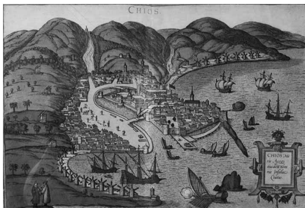
Fig. 3 - La città fortificata e i borghi di Chio in un'immagine del XVI secolo.