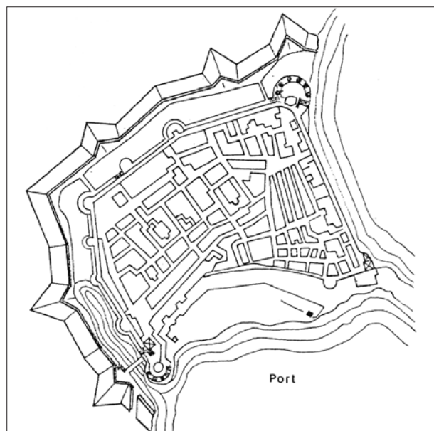
Fig. 5 - Il castrum di Chio nel XVI secolo (elaborazione da M. BALARD, La Méditerranée médiévale. Espaces, itinéraires, comptoirs , Paris 2006).

A rinforzare le difese dell’isola, oltre all’esistenza stessa di una cospicua forza navale ispano-genovese che, pur fisicamente lontana dalle acque egee, assolveva fundamentalmente alla funzione che potremmo definire di “ fleet in being ”, intervenne anche una estesa campagna di edificazione di fortificazioni tanto sulla costa quanto nell’entroterra isolano con una du-