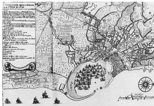
Fig. 4 - La città e il porto di Chio in una stampa del XVII secolo.

gnolo 12 , consentiva ancora ai membri della Maona 13 di continuare a pagare (sia pure con ritardi talvolta difficilmente giustificabili) il tributo annuo dovuto alla Sublime Porta, salito negli anni fino a 12.000 ducati, e di trarre comunque guadagni dalla gestione delle risorse dell'isola.