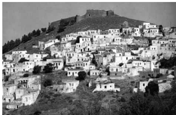
Fig. 7 - Il castello di Volissos.

terno, quanto quelle costiere, fu oggetto di particolari cure durante l'ultimo periodo del dominio genovese. Una lunga serie di contratti, conservati all'interno delle filze dei notai che rogarono nell'isola in quegli anni, ci consente di seguire le vicende di quest'opera di fortificazione almeno a partire dal 1515.