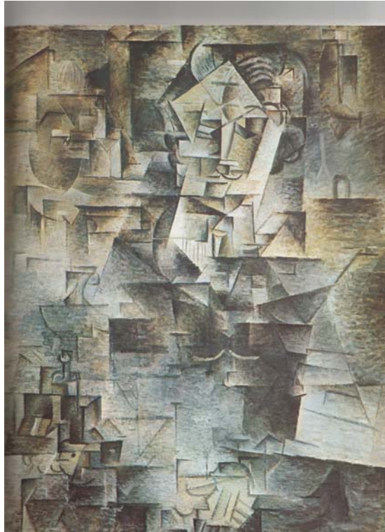
Picasso, Portrait of D.H. Kahnweiler (Paris 1910), Oil on Canvas, Chicago, The Art Institute

Se guardiamo i suoi primi quadri cubisti, rintracciamo qualcosa della descrizione di Jacob fatta dall'anziana signora sul treno e composta di "face-mouth-lips-eyes". Il Portrait of Daniel Henry Kahnweiler (1910) di Picasso, per esempio, fa parte di una serie di ritratti cubisti in cui il soggetto ritratto, così come i colori usati, sembrano svaporare. Nonostante la sperimentazione cubista richieda che l'oggetto venga demolito al punto di essere a malapena riconoscibile, e che i colori brillanti vengano evitati in favore di una soluzione quasi monocromatica e livida, Picasso chiedeva regolarmente ai suoi modelli di posare per i ritratti. Così il modello posava per ore estenuanti, ma sulla tela ogni somiglianza svaniva. Nel caso specifico del ritratto in questione, la superficie della tela risulta divisa in minuti frammenti, e lo sguardo dello spettatore può carpire qua e là un naso, un paio di occhi, capelli ben ravviati, la catena di un orologio, le mani incrociate. La facoltà di ricombinare quegli elementi è lasciata all'immaginazione dello spettato-