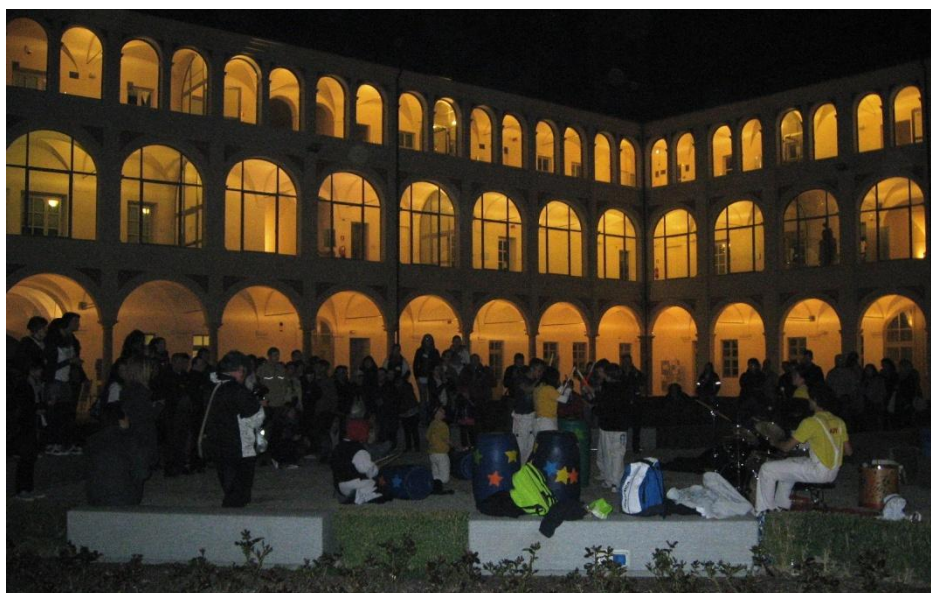
Figura 13- I Drum Theatre e il pubblico nel cortile dell'università

Forse siamo tutti un po' stanchi ed affamati, ma lo spettacolo è davvero travolgente: i ragazzini saltano, ballano, suonano le percussioni e trascinano il pubblico in un altro momento di festa.