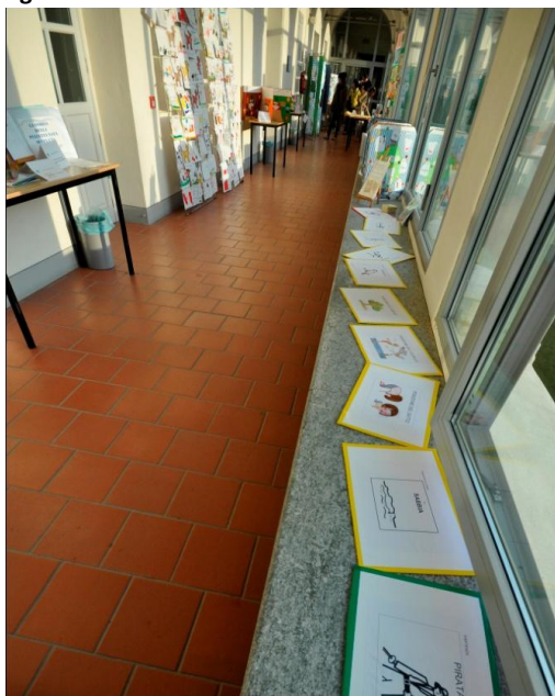
Figura 2- La mostra nei corridoi dell'università

Non c'è più niente da fare, l'università è vuota e bella e il meteo- anche se non caldissimo- è favorevole. Il telefono della segreteria di SENZA MURI , due cellulari personali che da settimane squillano ogni 4 minuti, offre una tregua che si rivelerà tuttavia del tutto temporanea.