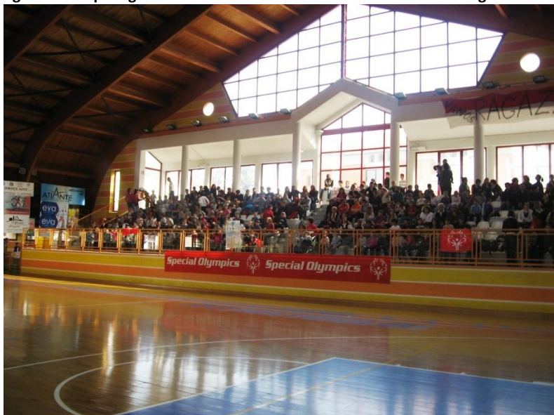
Figura 7- Gli spalti gremiti del Palaferrea in occasione del Basket integrato

E allora la festa non poteva che cominciare: mentre in campo le squadre si sfidavano all'ultimo canestro (vincerà il torneo la squadra mista Cuore Matto di Torino-Ist.Sup.Arimondi, grazie ad una schiacciante superiorità tecnica), sugli spalti le volontarie improvvisavano balli e animazione. I bambini gridavano, tifavano e ballavano, mentre a bordo campo i ragazzi “atleti partner” battibeccavano per decidere a chi toccasse entrare in campo. Un successo!