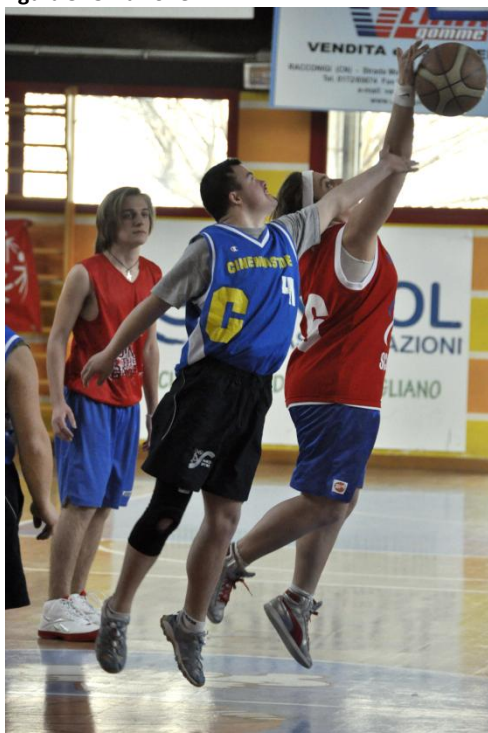
Figura 8- Un'azione

E allora la festa non poteva che cominciare: mentre in campo le squadre si sfidavano all'ultimo canestro (vincerà il torneo la squadra mista Cuore Matto di Torino-Ist.Sup.Arimondi, grazie ad una schiacciante superiorità tecnica), sugli spalti le volontarie improvvisavano balli e animazione. I bambini gridavano, tifavano e ballavano, mentre a bordo campo i ragazzi “atleti partner” battibeccavano per decidere a chi toccasse entrare in campo. Un successo!