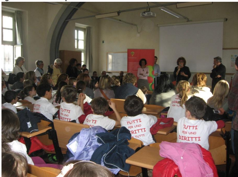
Figura 3- Bambini alla premiazione del concorso

Dopo la premiazione, in attesa del collegamento internet che avrebbe trasmesso in streaming la lezione del prof Canevaro, i bambini hanno letteralmente invaso l'università. Giocavano in cortile, inseguendosi nella ghiaia e saltando sulle panchine. Alcuni, con le famiglie, salivano al primo piano a vedere la mostra, dove qualche studente-volontario li conduceva nella visita. Bambini, genitori, studenti e cittadini hanno attraversato l'Università a partire da mercoledì usandola come luogo di ritrovo, di incontro e di pensiero. Il legame tra l'università ed il territorio, tanto più fondamentale nelle sedi decentrate, si mostrava nella sua veste concreta ed umana: erano le persone a farlo concreto, non semplicemente i protocolli di intesa tra le istituzioni, gli accordi, le convenzioni.