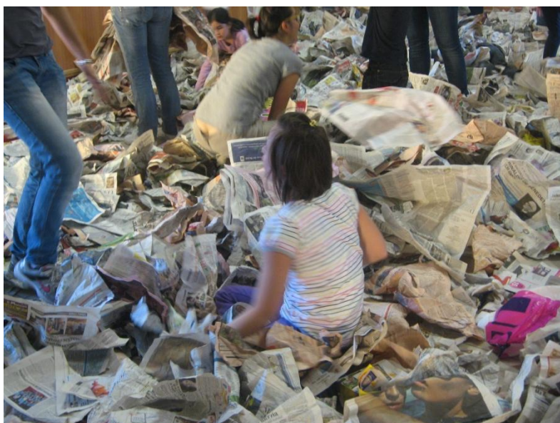
Figura 14- Per giocare cosa c'è di meglio di una stanza piena di giornali?

Alla sera siamo tutti stanchi, le famiglie si riuniscono e tornano a casa, ciascuna con il loro marziano sotto braccio.