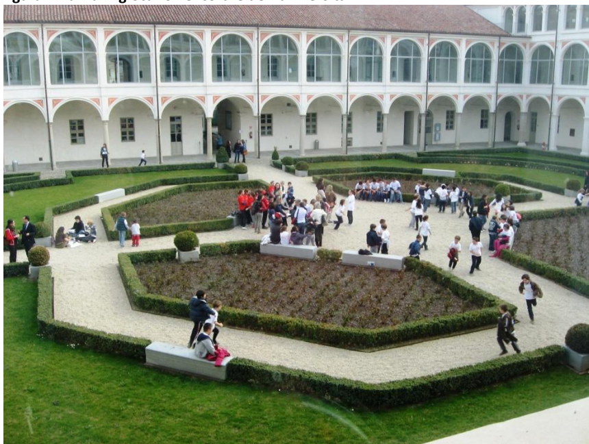
Figura 4-Bambini giocano nel cortile dell'università

Altro momento di fertile incontro tra l'accademia e la società civile è stata la lezione del professor Canevaro. Verso le sei molti dei bambini erano andati via con i loro insegnanti,