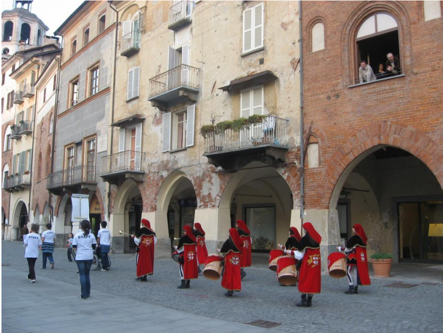
Figura 10- I tamburini di Alba ed alcuni volontari in piazza a Savigliano

Le persone si affacciavano alle finestre, chi camminava si fermava a guardare, i bambini si facevano attorno. I volontari, distribuivano volantini con i prossimi eventi: ora non si può proprio dire che via sia qualcuno a Savigliano che non ha sentito parlare di SENZA MURI e della Convenzione ONU per i diritti delle persone con disabilità.