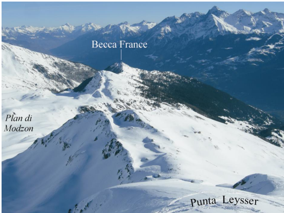
Fig. 3 - Gli estesi sdoppiamenti di cresta, con lunghezza complessiva di oltre 1 Km, compresi tra la P. Leysser (in primo piano) e la Becca France osservati da ovest.

Il modellamento gravitativo è invece testimoniato dalla diffusione di rocce del substrato metamorfico molto fratturate e allentate e da una serie di evidenze morfologiche, tra cui particolarmente significativi sono gli estesi sdoppiamenti di cresta compresi tra la P. Leysser e la Becca France (Fig. 3). Nel dettaglio l'area del Plan di Modzon è caratterizzata dalla presenza di numerosi gradini morfologici e depressioni chiuse che rappresentano l'espressione superficiale, rispettivamente, di gradini di scivolamento e di trincee gravitative responsabili della morfologia articolata del ripiano (Fig. 1). Numerosi gradini di scivolamento si sviluppano immediatamente a valle di Plan di Modzon lungo la zona di debolezza rappresentata dal contatto tettonico tra le due unità del substrato metamorfico. L'insieme degli elementi morfologici e geologici suggerisce come l'area sia stata coinvolta nell'estesa DGPV di P. Leysser.