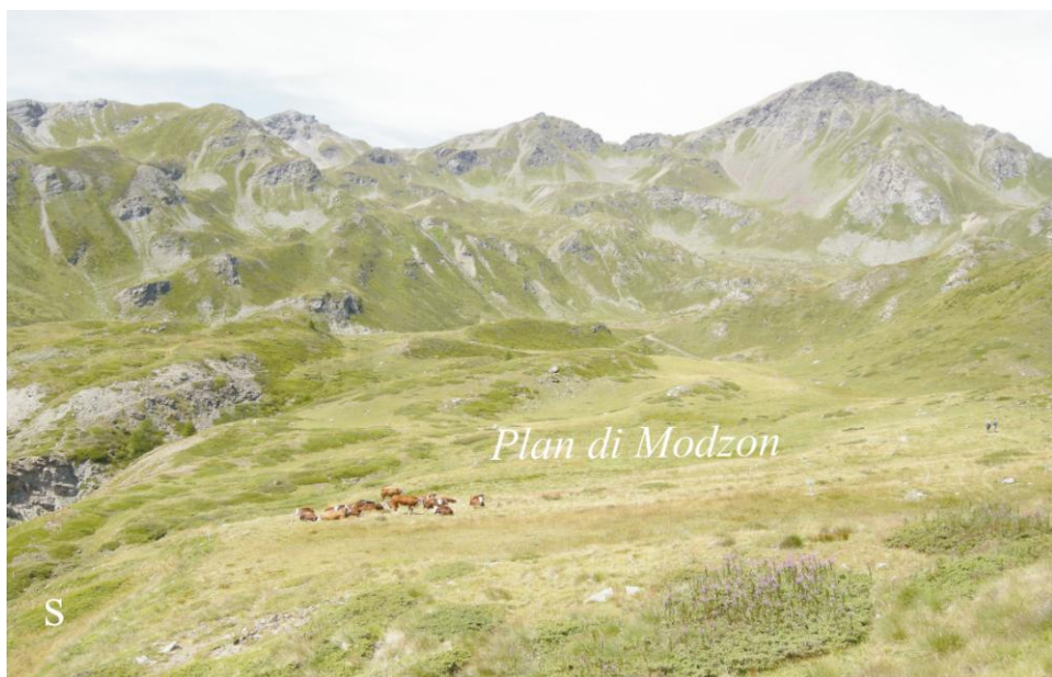
Fig. 1 - Panoramica dell'area del Plan di Modzon corrispondente a un ampio ripiano, caratterizzato da numerosi rilievi e depressioni e delimitato da un'evidente soglia in roccia (s).

L'area di Plan di Modzon è ubicata nel versante sinistro della Valle d'Aosta, drenata dal F. Dora Baltea, circa 9 km a NO della Città di Aosta. In particolare si sviluppa nella conca del Fallère, ad una quota compresa tra 2260 e 2300 m, e coincide con l'ampio fondovalle di un piccolo bacino tributario, la Valle Verrogne, debolmente inclinato verso sud e sensibilmente sospeso rispetto alla valle principale tramite una evidente soglia in roccia (Fig. 1). L'area presenta una morfologia del tutto particolare nell'ambito del paesaggio valdostano. Oltre a corrispondere a un ampio ripiano, caratterizzato nel dettaglio da blande ondulazioni longitudinali, appare debolmente inciso da un reticolato idrografico articolato, costituito da tre principali corsi d'acqua subparalleli (T. Verrogne occidentale, intermedio e orientale) e da numerose incisioni abbandonate.