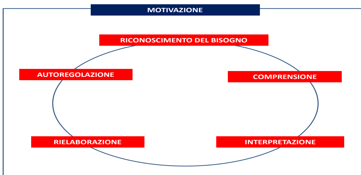
Tav. 4 Comunicare-comprensione

Sullo sfondo viene dato rilievo alla motivazione all'ascolto, in quanto componente fondamentale nel modo di porsi del soggetto verso l'attività e nella conseguente attivazione delle proprie risorse; componente particolarmente significativa in un contesto, quello scolastico, che spesso, in modo più o meno consapevole, svolge una funzione depressiva, più che promozionale, nei confronti della fruizione comunicativa.