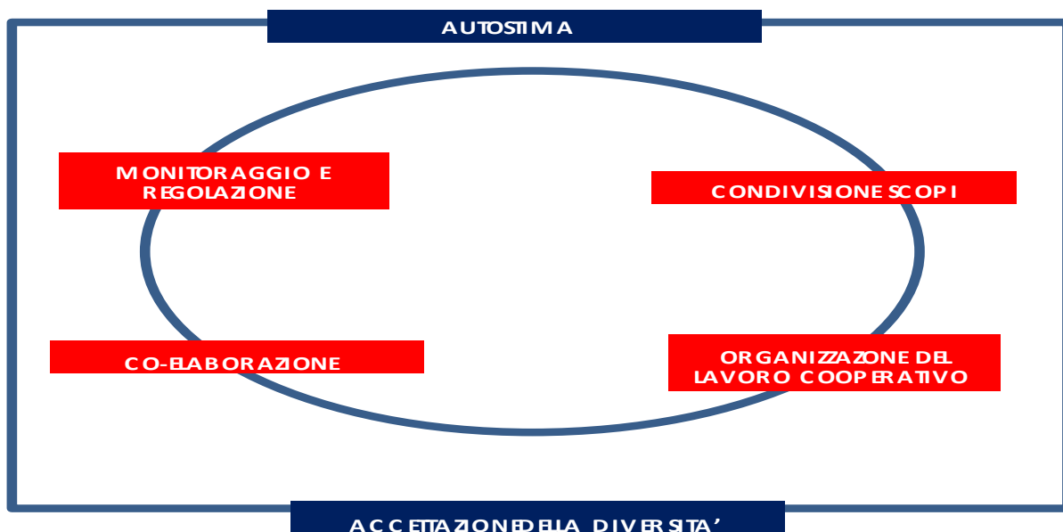
Tav. 3 Collaborare e partecipare

Proprio la polarità individuale/gruppale consente di riconoscere le dimensioni proposte sia come riferite ad una valutazione del contributo che il singolo offre alla dinamica cooperativa, sia come riferite al gruppo nella sua totalità. In analogia con lo sguardo proposto sulle altre competenze chiave noi privilegeremo la prima prospettiva, ovvero l'osservazione del contributo individuale, sebbene inevitabilmente non possa che essere vista nel contesto del gruppo di lavoro e delle sue specifiche dinamiche.