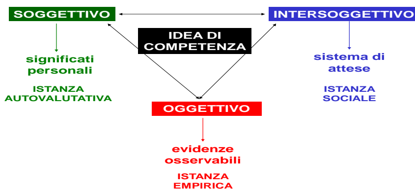
Tav. 1 Prospettive di valutazione della competenza.

La Tav. 1 sintetizza l'impianto di indagine proposto: una valutazione di competenza richiede di attivare simultaneamente le tre dimensioni di analisi richiamate, attraverso uno sguardo trifocale in grado di comporre un quadro di insieme e di restituire le diverse componenti della competenza richiamate nell'immagine dell'iceberg, sia quelle più visibili e manifeste, sia quelle implicite e latenti. Il rigore della valutazione consiste proprio nella considerazione e nel confronto incrociato tra le diverse prospettive, in modo da riconoscere analogie e differenze, conferme e scarti tra i dati e le informazioni raccolte. Solo la ricomposizione delle diverse dimensioni può restituire una visione olistica della competenza raggiunta, riesce a ricomporre l'immagine dell'iceberg nella sua complessità.