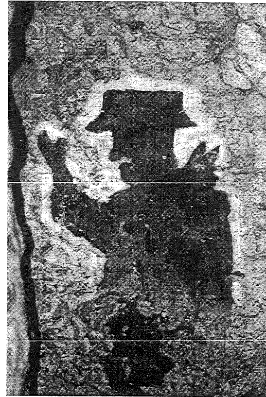
Figura 1, Imagen del sombrero dibujada en las paredes de la Cueva del Diablo, Tuxtla Gutiérrez, (fotografía de Sofía Venturoli).

ritual y su función dentro de una cultura (véase Venturoli, 2002; 2006; 2004b). Asimismo, los elementos del ritual, tanto como la entereza a lo largo del camino, nos comunican algo de los participantes del ritual (véase Venturoli en prensa), sus comprensiones de algunos espacios ideológicos dentro de una cosmovisión del mundo.