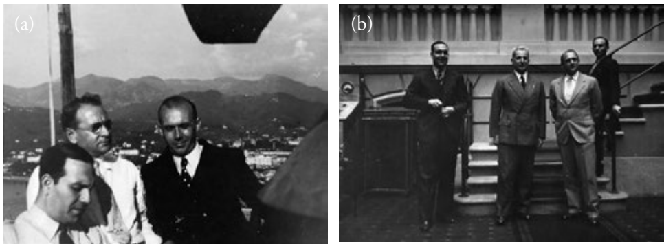
Fig. 3 (a) Giuseppe Biondo (sinistra) e Vladimir Zworykin (secondo da sinistra), al centro dell'immagine un funzionario tedesco non identificato, Germania [1934], retro autografato a firma di Zworykin con data «Oct 25, 34» – la fotografia è stampata da uno studio di Berlino; (b) Giuseppe Biondo (a sinistra) e Vladimir Zworykin (a destra), al centro un funzionario tedesco non identificato, Germania [Berlino 1934].

Nello stesso periodo, in Germania, fu portata a compimento una delle più significative evoluzioni della storia dell'incisione magnetica. Sulla base dell'invenzione di Pfleumer del 1928, la «sounding paper 16 », l'AEG diede inizio alla costruzione in prototipo di registratori sviluppati, significativamente, da un team di ingegneri precedentemente impiegati nel progetto di registratori ottici. Contemporaneamente, presso la sede di Ludwigshafen della I.G. Farbenindustrie Aktiengesellschaft (poi BASF), il chimico Friedrich Matthias lavorò alla produzione di prototipi di nastri in acetilcellulosa (con strato magnetico da 6.5 mm, 5 mm 17 ) mentre l'AEG si servì delle nuove «ring heads» brevettate da Eduard Schüller 18 per la costruzione dei primi prototipi di uno strumento ribattezzato «magnetofono» nell'immediatezza dell'esposizione di Berlino del 1934 19 .