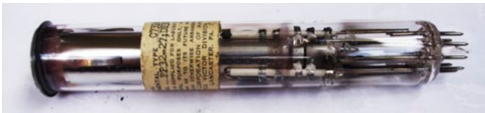
Fig. 4 Vidicon Tube, prototipo in sviluppo presso gli RCA Lab., fotografato il 15/5/2013, AIR.

ricana mancò questo appuntamento. La trasformazione del gruppo gemellare Telonda-Cineonda in RTI, Radio e Televisione Italiana, su cui torneremo tra breve, dimostra tuttavia che la partita della televisione in Italia era tutt'altro che chiusa. Un reperto raro, di poco successivo a questo momento, è conservato negli archivi dell'International Recording: si tratta di due unità Vidicon spedite alla Telonda allo scopo di valutare prototipi in sviluppo presso i laboratori della RCA, che di qui a pochi mesi saranno impiegati in prodotti ritenuti strategici. I «tubes», uno dei quali è riprodotto in Fig. 4, sono contenuti in una busta non datata, autografata da Zworykin 52 e indirizzata a G. A. Biondo, presso la sede della Telonda di New York. Il Vidicon è una significativa evoluzione dell'iconoscopio e dell'orticonoscopio e venne impiegato nelle camere miniaturizzate RCA, esposte al NAB 53 nel 1950 (ma col nome di «videcon») e commercializzate a partire dal 1952 come «miniaturized camera tubes» (6198 Vidicon Camera Tube), con relativo apparato di trasmissione, a uso delle troupe televisive in esterna 54 .