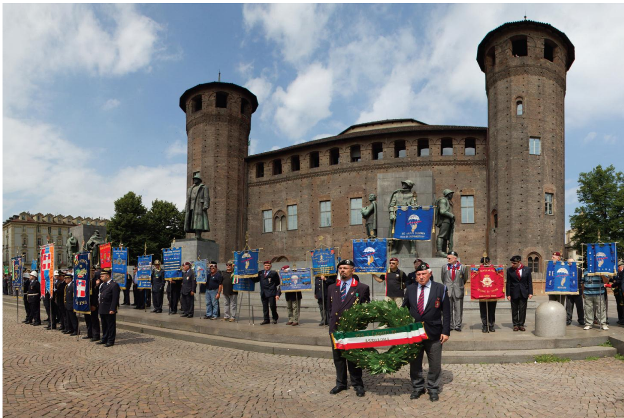
16 marzo 2014 - Le associazioni d'Arma di Torino ricordano la giornata dell'Unità d'Italia, della Costituzione, dell'Inno e della Bandiera.