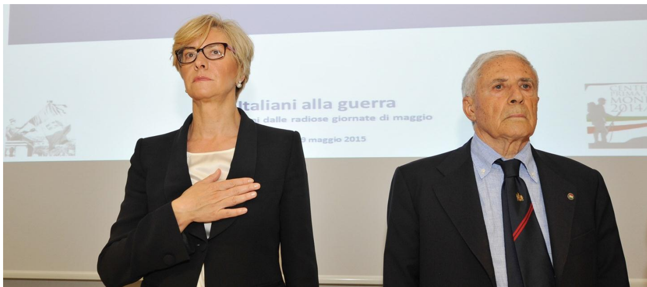
Il Ministro della Difesa Roberta Pinotti e il presidente Franco Marini durante l'esecuzione dell'Inno nazionale.