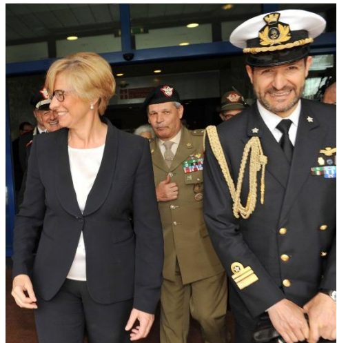
Il Ministro della Difesa a fine convegno.