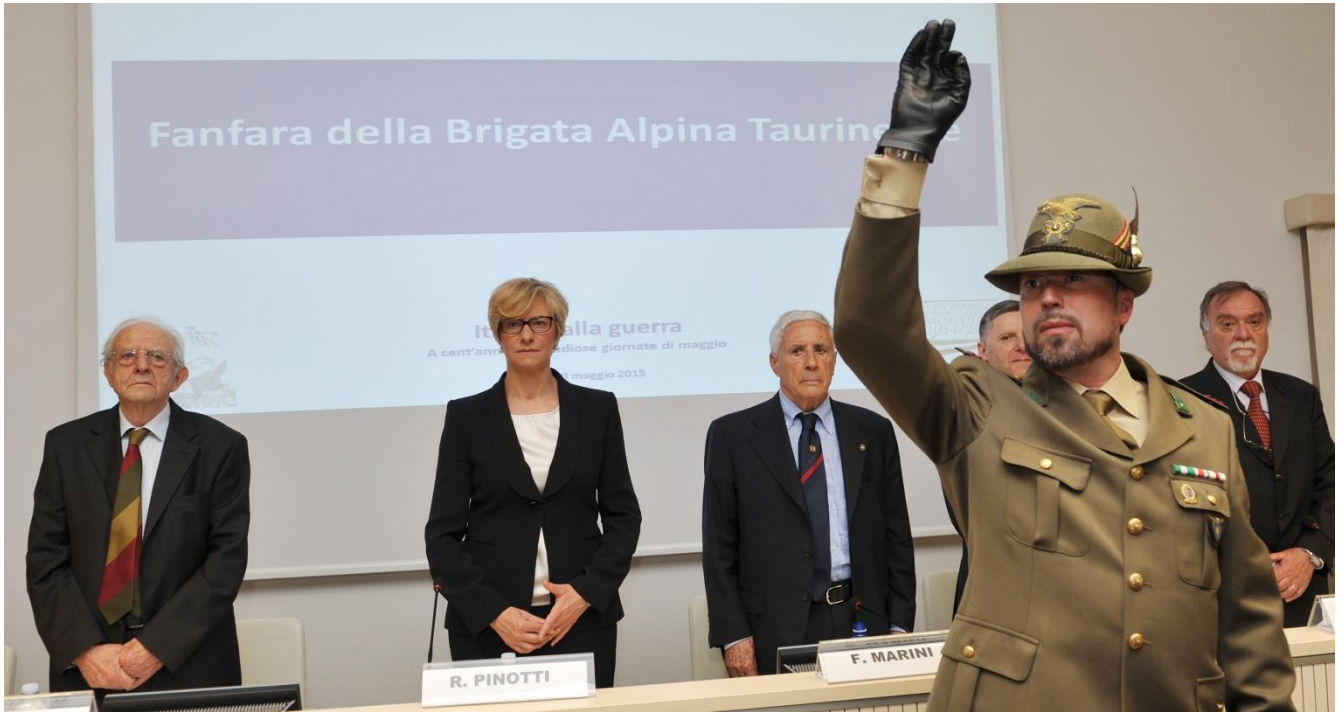
Il Ministro e gli altri relatori durante l'esecuzione dell'Inno nazionale da parte della Fanfara della Brigata Alpina Taurinense.