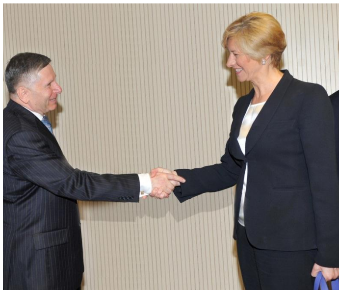
Il Generale Cravarezza e il Ministro della Difesa.