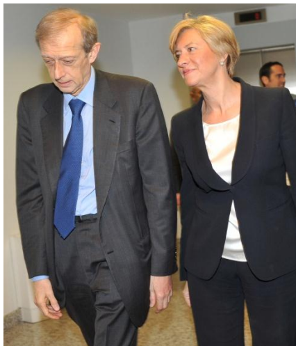
Il Sindaco Fassino e il ministro Pinotti.