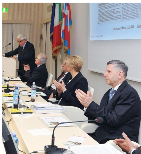
Il Generale Cravarezza al tavolo dei relatori.