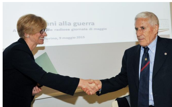
Il ministro Roberta Pinotti e il presidente Franco Marini.