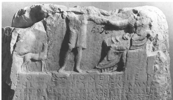
Fig. 3: IG I 3 61

Con questa mozione finale Cleonimo si presenta come punto unico di riferimento in Assemblea per tutte le questioni circa il tributo e le città alleate, temi che evidentemente sono al centro della sua azione politica e delle priorità della polis . Rispetto al primo provvedimento si deve però notare che questo secondo decreto di Cleonimo è improntato alla precisione nello stabilire un limite alle importazioni detassate: con puntualità si fissa la procedura per usufruire del movimento di merce senza tasse; con efficienza si precisa la contropartita ai vantaggi erogati; con attenzione si puntualizza che tutti i privilegi devono discendere da un provvedimento specifico e quindi non si possono applicare esenzioni non deliberate; con prudenza si decide di attendere l'esito dell'ambasceria a Perdicca prima di opzionare le mosse successive (al contrario di quanto fatto nel primo decreto). Questo alto livello di dettaglio tecnico rivela competenza nella stesura della proposta di decreto, ma anche progettualità politica che, per Metone, come per altre città alleate, misura vantaggi e svantaggi, nonché contropartite dei privilegi riconosciuti.