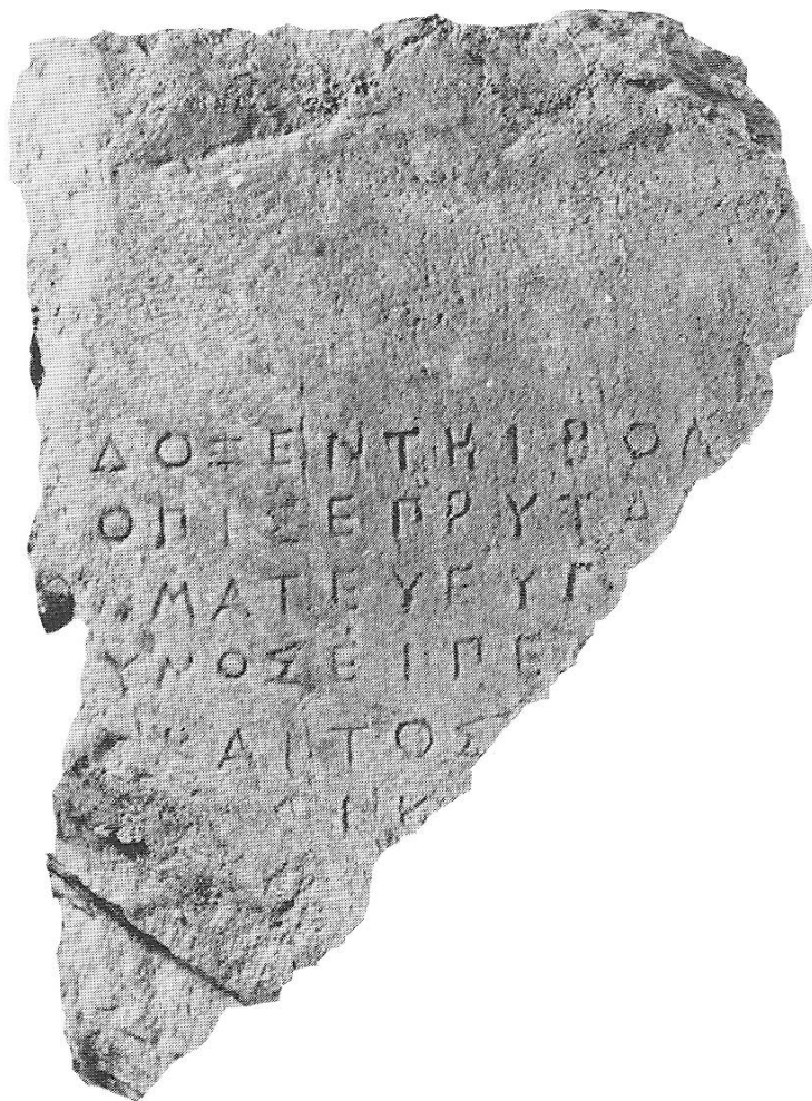
Fig. 1: IG I 3 69