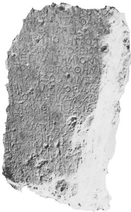
Fig. 2: IG I 3 70

Un'ulteriore attestazione del nome di Cleonimo, parzialmente integrato nelle lettere iniziali, è stata individuata in un frammento ritrovato a Delo 4 : nonostante siano leggibili solo poche lettere del prescritto, che tuttavia presenta caratteristiche che riconducono all'uso ateniese, questa iscrizione ha fornito un indizio prezioso per intuire un ruolo di Cleonimo nella purifica-