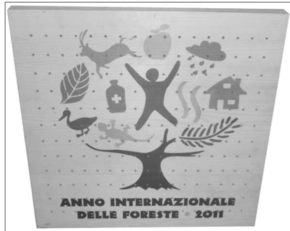
Figura 2. Quadro fotoassorbente. Figure 2. Sound absorbing frame.