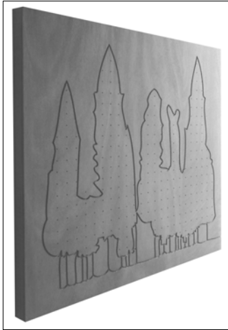
Figura 1. Pannello fotoassorbente. Figure 1. Sound absorbing panel.