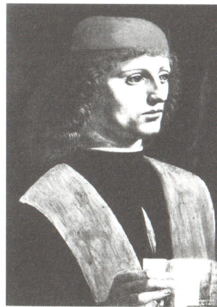
Abbildung 2: Leonardo, Ritratto di musico , ca. 1485 (Pinacoteca Ambrosiana, Mailand)

Finsternis entbehrt des Lichtes und Licht entbehrt der Finsternis: Schatten, schreibt Leonardo, »ist Mischung von Finsternis mit Licht«, und ist umso mehr oder minder Dunkelheit, je mehr das Licht, welches sich mit diesem mischt, von größerer oder minderer Kraft ist. AB, HK und CD sind die Zwischensektionen des zu portraitierten Gegenstandes, Sektionen, die mehr oder weniger (und zwar auf umgekehrt proportionale Weise) an den beiden Pyramiden Teil haben. Diese Figur erweist sich als ideal zur Positionierung des auf einer Schwelle zu portraitierten Antlitzes an der rechten Stelle, damit Licht und Schatten jenen sanften Kontrast schaffen, der die Hervorhebung begünstigt: das Portrait kann Leonardo zufolge nämlich weder in vollem Sonnenlicht (am hellen Tag, bei offenem Himmel, »auf dem Land voller Licht«), 73 noch gänzlich der Basis der Pyramide der Dunkelheit (was zur totalen Abwesenheit von Licht, zur absoluten Unerkennbarkeit führen würde) verhaftet angefertigt werden. Nur in den Zwischenstufen ergibt sich die Hervorhebung, an der Stelle, wo Schatten und Licht zu einer Komposition und einem