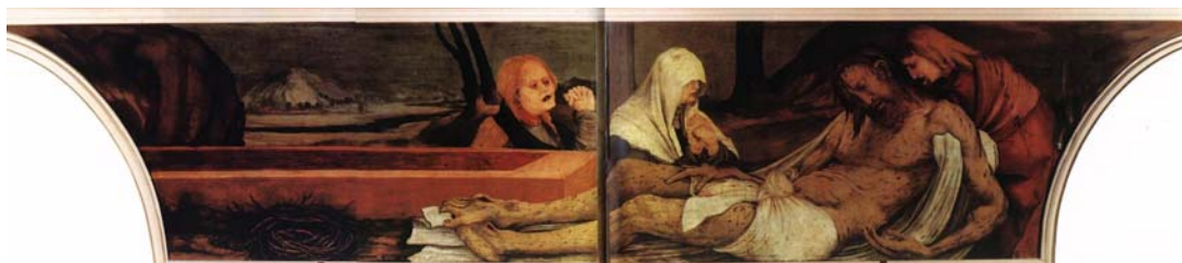
Hans Holbein, Isenheimer Altar , Predella della Deposizione (Musée d'Unterdenlinden, Colmar)

Una tale «forza oscura, insolente e stupidamente eterna», superiore alla stessa divinità (quella di un destino cieco e necessitante), è l'oggetto di un «naturalismo mistico» che sopravvive alla stessa morte di Cristo — così si esprime Joris-Karl Huysmans in un confronto serrato tra il Cristo morto di Holbein e il polittico di Isenheim di Matthias Grünewald (Musée d'Unterdenlinden, Colmar), la cui predella reca ancora l'immagine di una deposizione, ma dove il «carnaiolo divino» è mitigato (direi pietosamente velato ) dalla presenza di una Vergine velata sino agli occhi, una Maddalena sfigurata dalle lacrime e da san Giovanni che avvolge per pudore il corpo di Cristo in un candido sudario (Huysmans 2002, p. 58).