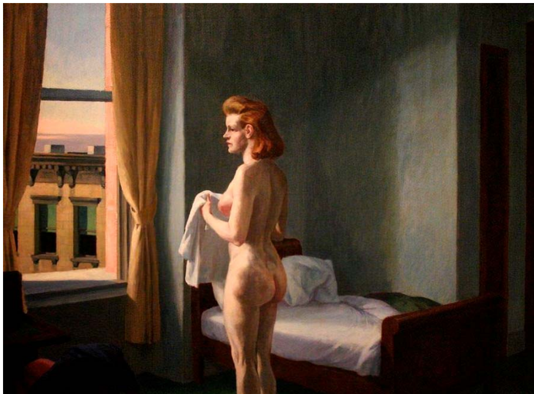
Edward Hopper, Morning in a City , 1944 (Williams College Museum of Art)

Il terzo esempio, in questa transizione dal velo pietoso alla nudità blasfema di una visione senza veli, è offerta dallo sguardo del voyeur . Si tratta di quello sguardo cosale e reificato descritto magistralmente da Edward Hopper, «maestro del silenzio e dello spazio vuoto» (O'Doherty 2000, p. 72), che si è soffermato con maestria sulle anomalie e sul disagio contemporaneo du regard — sguardo perso in una realtà sociale in cui l'anima (o quel che resta di essa) è costantemente aperta/estroflessa sul mondo. La finestra spalancata sulle vie di una città americana, in Hopper, è la cifra dell'oscenità dello spirito perso nelle trame dei consumi; interiorità mercificata, esibita come una merce fra le altre in una casa-vetrina ( house-window ) che non preserva in sé alcun meandro al riparo dal neutro e tirannico Man (per dirlo con lo Heidegger di Sein und Zeit ): così si fa, così si spende, così si vive, così si gode, così si consuma; di fatto, in questa medietà intransigente, «la pubblicità oscura tutto e presenta ciò che risulta così dissimulato come notorio e accessibile a tutti» (Heidegger 2005, p. 164).