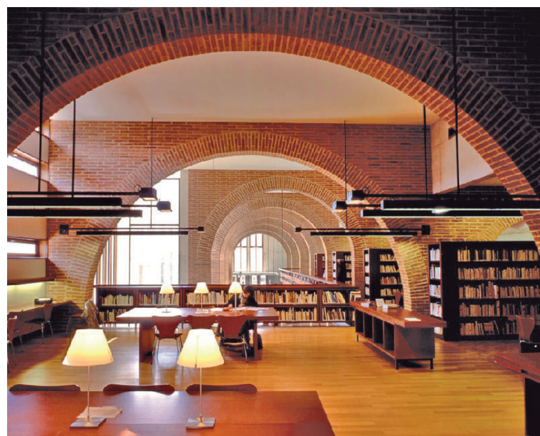
Biblioteca "Abbé-Grégoire" di Blois, Francia

Key feature of the Information Commons is the coordinated and extended set of study and workspaces offering an array of options ranging from traditional individual study to collaborative conference areas. 18