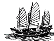
figure che ha permesso a Heller-Roazen di tracciare una genealogia che collega le posizioni dei giuristi latini nei confronti della pirateria a ciò che accade, ad esempio, nella prigione di Guantanamo Bay. Anche il terrorista, infatti, è indicato come nemico dell'umanità; la lotta al terrorismo, da questo punto di vista, si presenta come un'operazione trasversale che supera i confini statali, mettendo così in discussione la concezione classica di sovranità territoriale 50 .

La definizione 'nemico di tutti/nemico dell'umanità' rappresenta, inoltre, un potente dispositivo biopolitico, sul quale occorre riflettere con attenzione. Essere nemico dell'umanità significa propriamente non far parte dell'umanità, abitare una zona di non-umanità nella quale tutto è permesso. Il presunto terrorista è, così come il pirata, catturato in uno stato anomico permanente nel quale l'eccezione è diventata la regola: egli è il bersaglio di una caccia all'uomo globale, che sfonda qualsiasi confine statale e mette in crisi il concetto stesso di sovranità territoriale. Fra gli agenti di questa polizia globale troviamo dispositivi come droni e satelliti, che degradano il soggetto al rango di immagine e bersaglio.