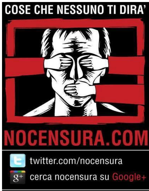
Figura 2 9

like per pagina) 8 . Le stesse pagine sono incisive e di facile individuazione in quanto sono costruite a partire dall'impatto visivo (un esempio su tutti la pagina Facebook di "Nocensura.com")