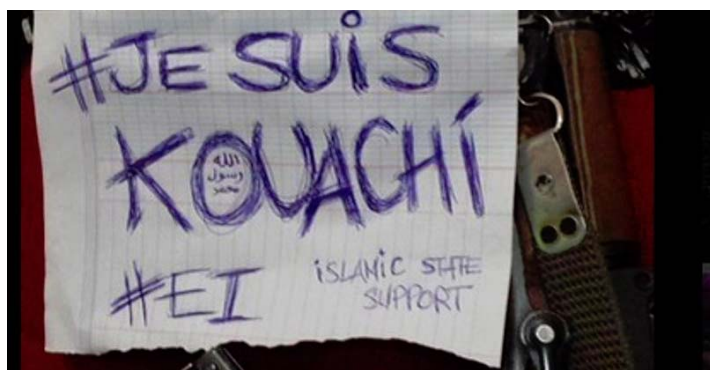
Fig. 4: Immagine postata sul web, adattando lo slogan “Je suis Charlie”, per manifestare sostegno ai terroristi.

L’affermazione di Dieudonné, però, non era isolata. Poco dopo, altre versioni dello stesso slogan hanno cominciato a diffondersi attraverso i social networks , talvolta adottando la forma grafica del segno “Je suis Charlie”. Queste versioni, tuttavia, anch’esse sostituivano, come quella di Dieudonné, il nome della rivista con quello dei terroristi, vale a dire, di nuovo Coulibaly o i famigerati fratelli Kouachi, perpetratori del massacro di Charlie Hebdo (Figura 4).