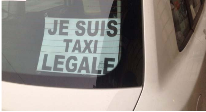
Fig. 2: Un poster “Je suis taxi legale” sul parabrezza di un taxi a Torino

A prima vista, potrebbe sembrare che questa struttura argomentativa sia additiva. “Non diciamo solo ‘je suis Charlie’; diciamo anche ‘je suis X’ o ‘je suis Y’”. In realtà, tuttavia, questo pattern argomentativo è sottrattivo. Parassita la carica emotiva che una collettività sta condividendo attorno a una certa questione al fine di canalizzare altrove parte di tale carica.