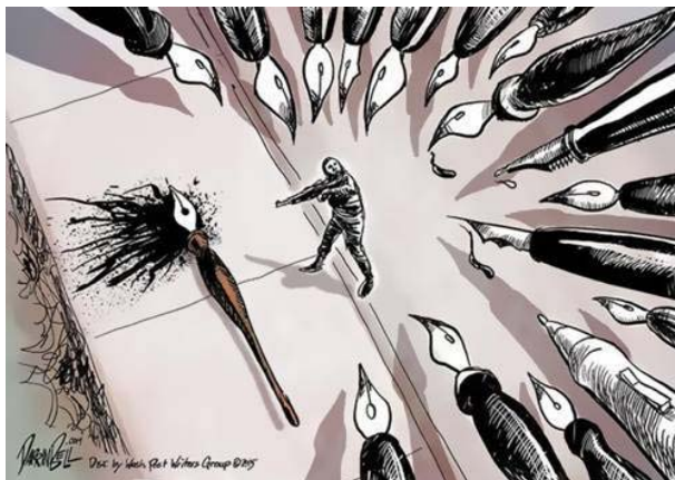
Fig. 1: Vignetta che enfatizza la forza della satira di Charlie Hebdo contro i terroristi

Una seconda reazione, altrettanto diffusa e immediata, è stata anch'essa visiva, ma ha incluso sia elementi verbali che grafici. Gli individui hanno cominciato a postare una specifica rappresentazione grafica della frase “Je suis Charlie” [“Io sono Charlie”], adottando lo stile tipografico tradizionale della rivista, di solito in bianco e nero, e in lingue diverse. Questa semplice frase era retoricamente forte in quanto basata su posizioni deittiche vuote: un “io” che si identificava con Charlie; un tempo coincidente con quello dell’enunciazione della frase stessa; nessuna indicazione spaziale. Di conseguenza, ognuno nel pianeta poteva appropriarsi questo “io”, abitare il tempo della sua enunciazione, e trasportarne il contenuto in qualsiasi latitudine. Cosa significava “Je suis Charlie”? All’inizio, un’espressione alquanto inarticolata di vicinanza umana, di empatia nei confronti di coloro che erano stati brutalmente assassinati per avere espresso in forma visiva le loro idee di sarcastico disprezzo nei confronti di ciò che essi consideravano oscurantismo islamico. In altre parole, le molte istanze di “Je suis Charlie” che hanno proliferato nel web non significavano esplicitamente “sono d’accordo con le idee dei vignettisti assassinati”, ma piuttosto “io sono te perché tu sei stato ferocemente assassinato a ragione di ciò che pensavi”, o persino più genericamente, “io sono te perché tu sei stato brutalmente assassinato mentre facevi il tuo lavoro” 3 .